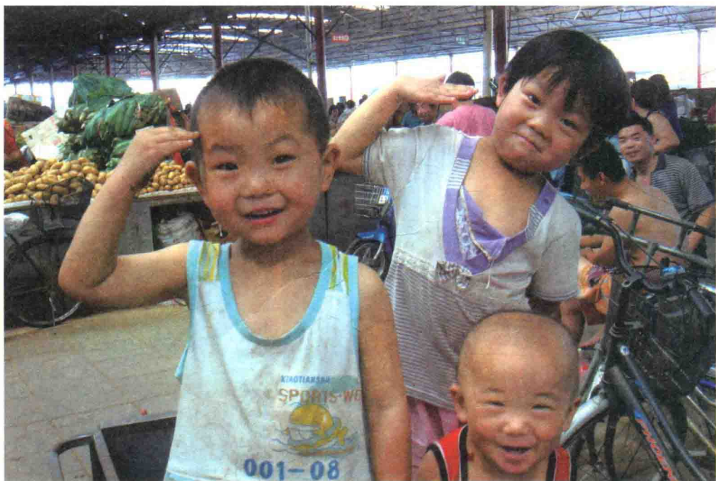
| 图 1-3 孩子们在市场三轮车上玩耍 |

正是有了在北京落脚的地方，四环市场商户得以服务于西城区菜篮子工程，得以完成家庭最开始的资金积累，得以在胡同里生儿育女开展生活，得以参与四环游戏小组互助育儿活动，丰富在北京的社会参与和社会融合经验。