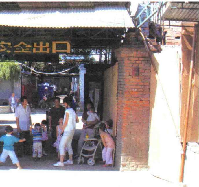
| 图 1-2 市场一角的孩子们 |

杂院儿的邻居基本都是外地人和做生意的，彼此相处起来也自在。胡同杂院儿附近生活方便，买个东西抬脚就到，所有这些便利条件是楼房所不具备的，成为四环附近流动人口社区形成的关键基础性条件。