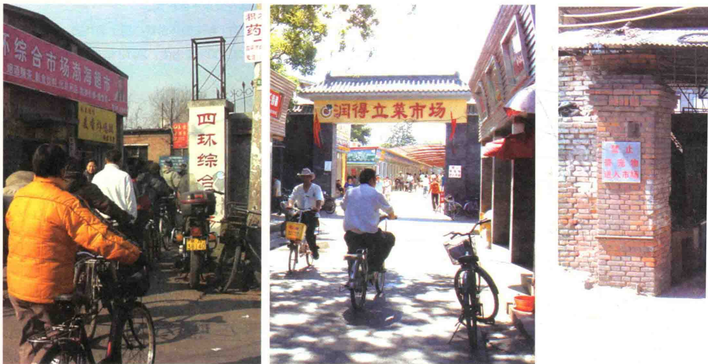
| 图 1-1 四环综合市场大门（旧，左图） 润得立菜市场东门（新，右图） |

从1999年到2014年，四环市场参与了北京菜篮子工程的起始，经历了15年的繁华经营，见证了什刹海地区的变迁，到2014年9月30日，因为城市环境规划升级被拆迁。