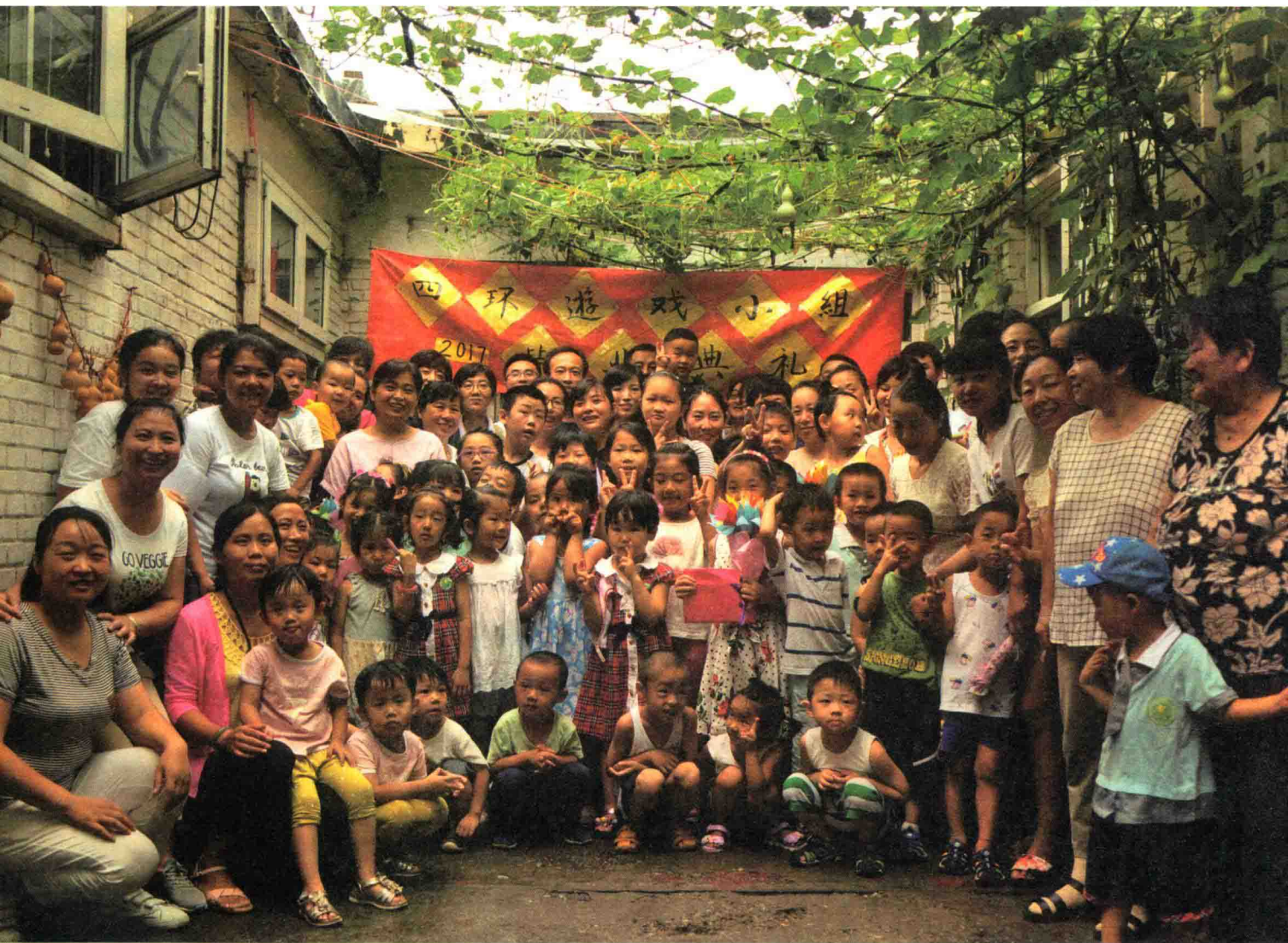
| 硕果累累的游戏小组送走了 2017 届毕业生 |