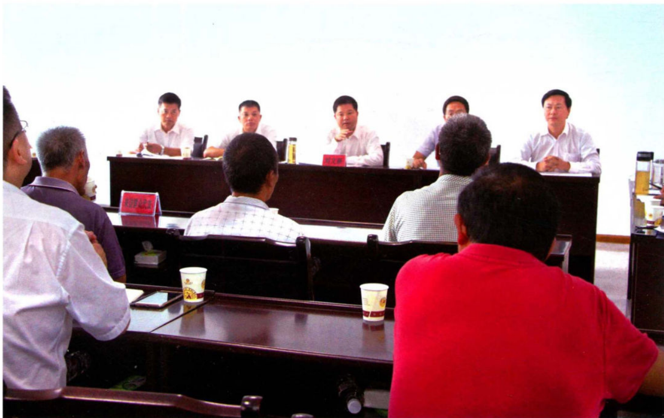
州委书记刘文新在安龙县群众工作中心接访