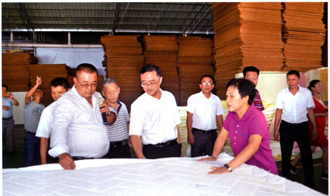
2017年8月10日，省政府副省长陈明鸣（前中）、州政府州长杨永英（前右）到安龙工业园区视察。