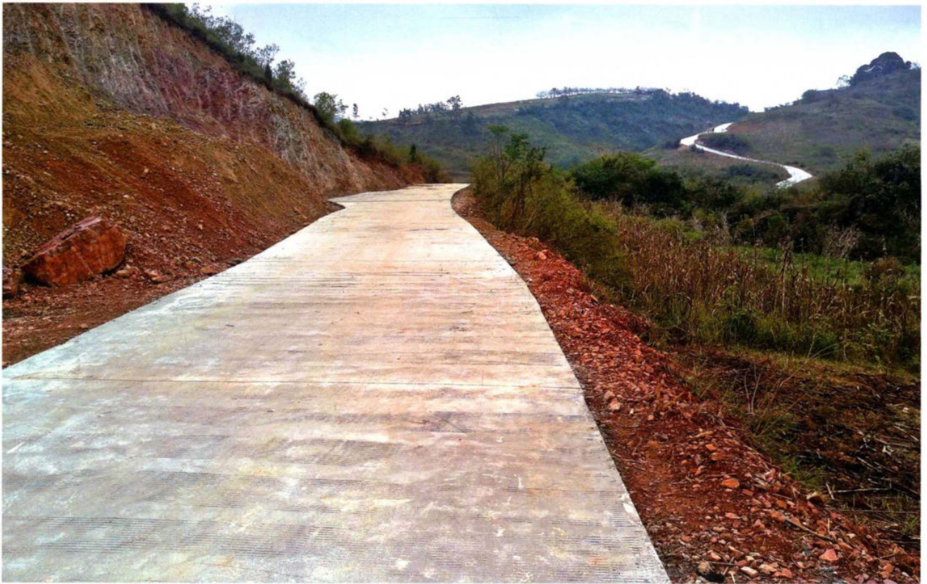
新桥镇木科村白泥田通组公路