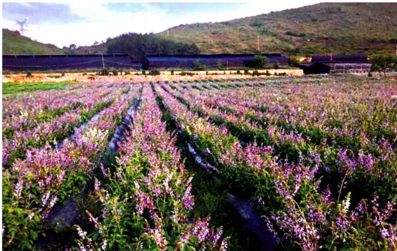
普坪镇乐旺村丹参种植基地