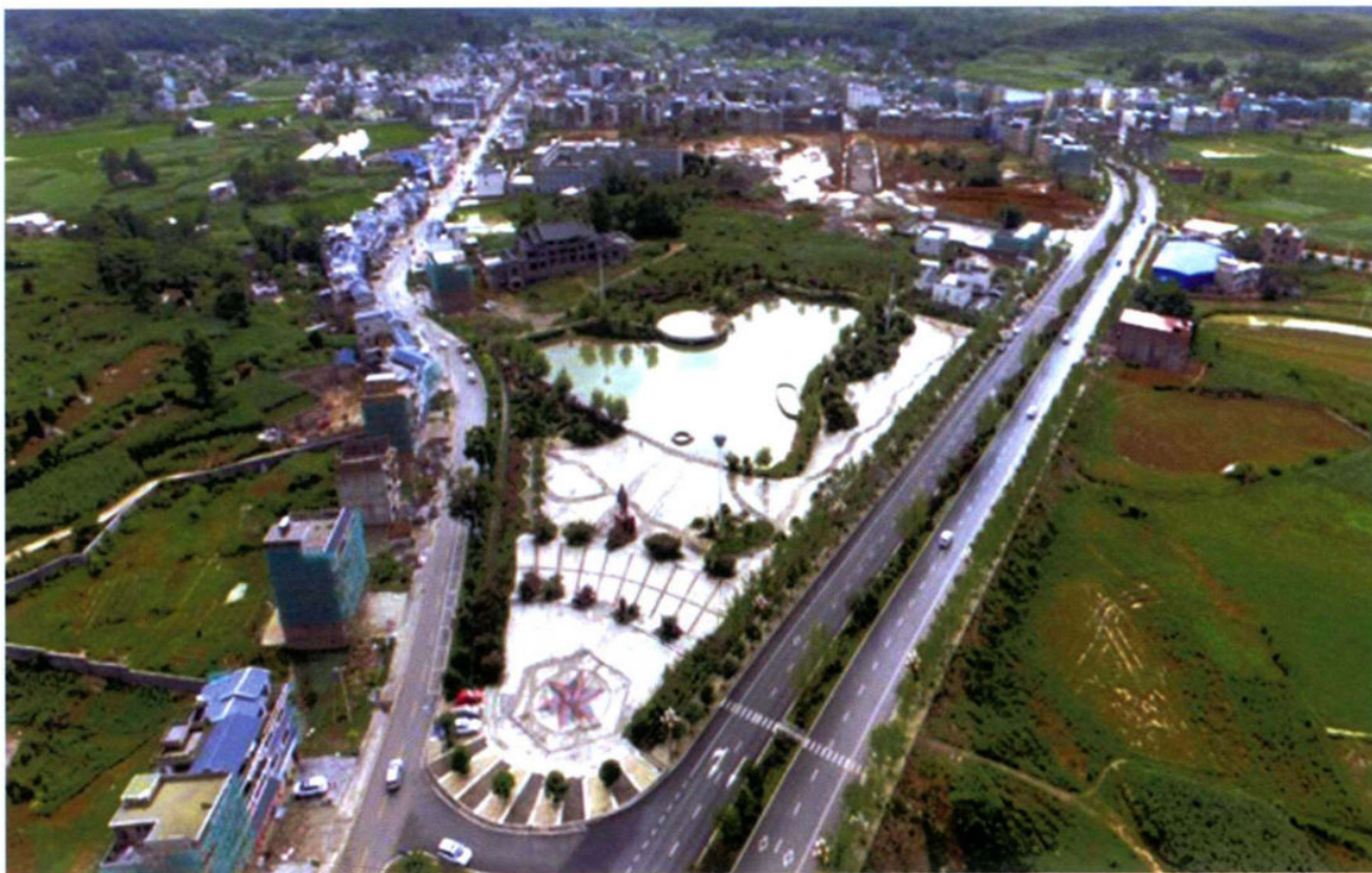
普坪镇小城镇建设鸟瞰