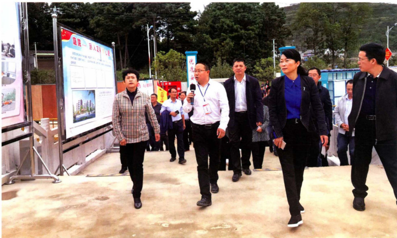
2017年10月20日，全州移民搬迁、组组通项目观摩会到钱相街道城北二期现场观摩，图为州政府州长杨永英（左1）参加观摩。