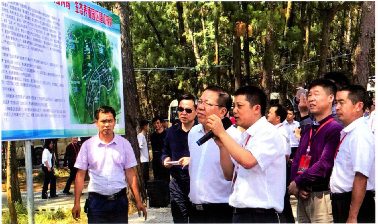
2017年3月28日，省委常委、省政府常务副省长秦如培（前左3）到钱相街道华一林下养鸡基地视察。