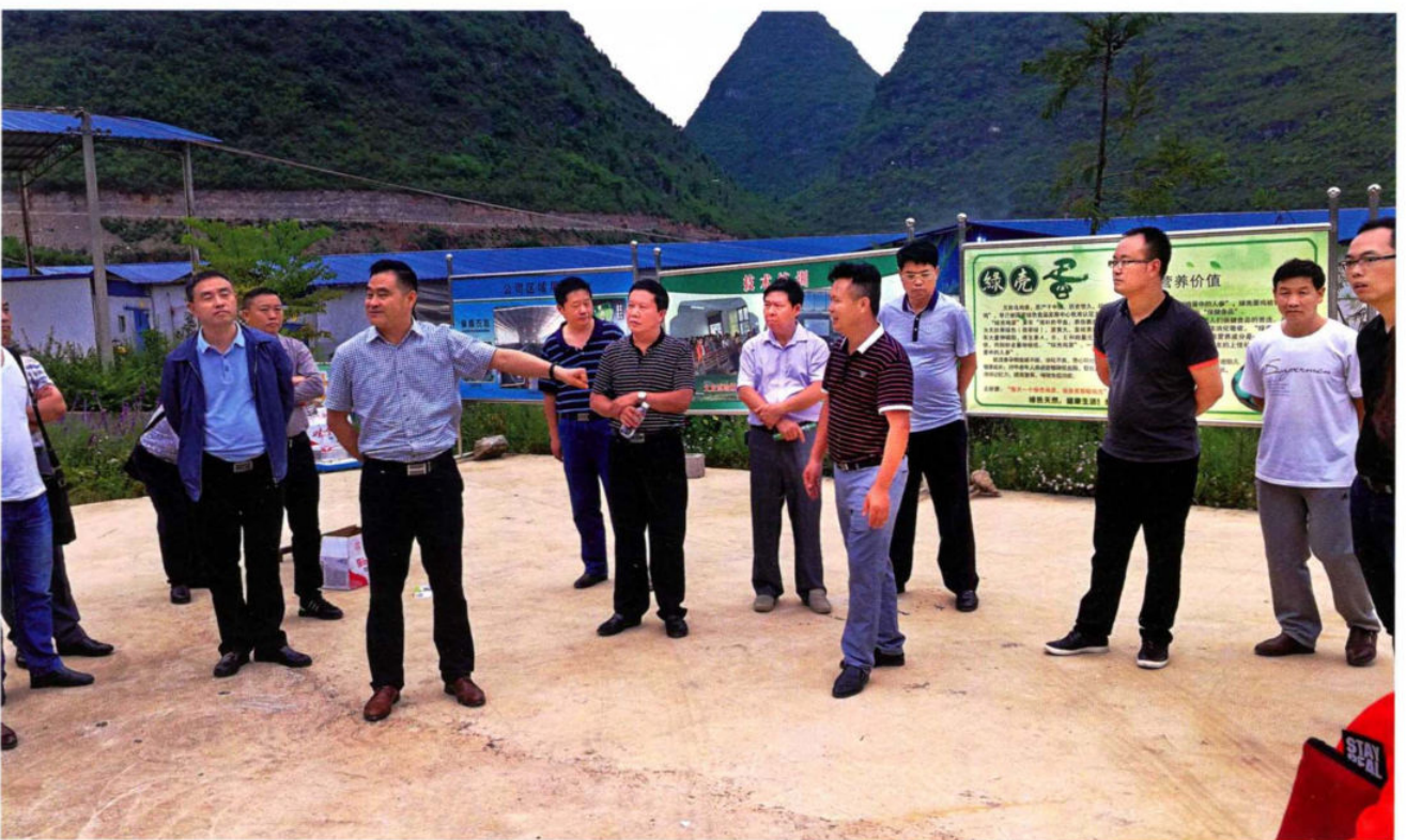
2017年6月12日，全省“农合联”第一片区（安顺市、六盘水市、黔西南州）现场观摩交流推进会安龙分会场现场。