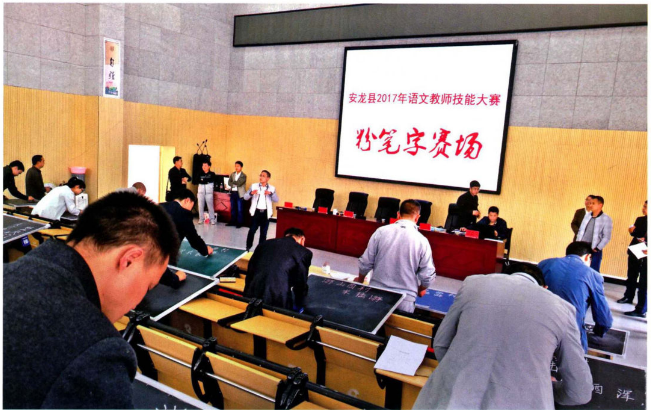
2017年，全县语文教师技能比赛现场。