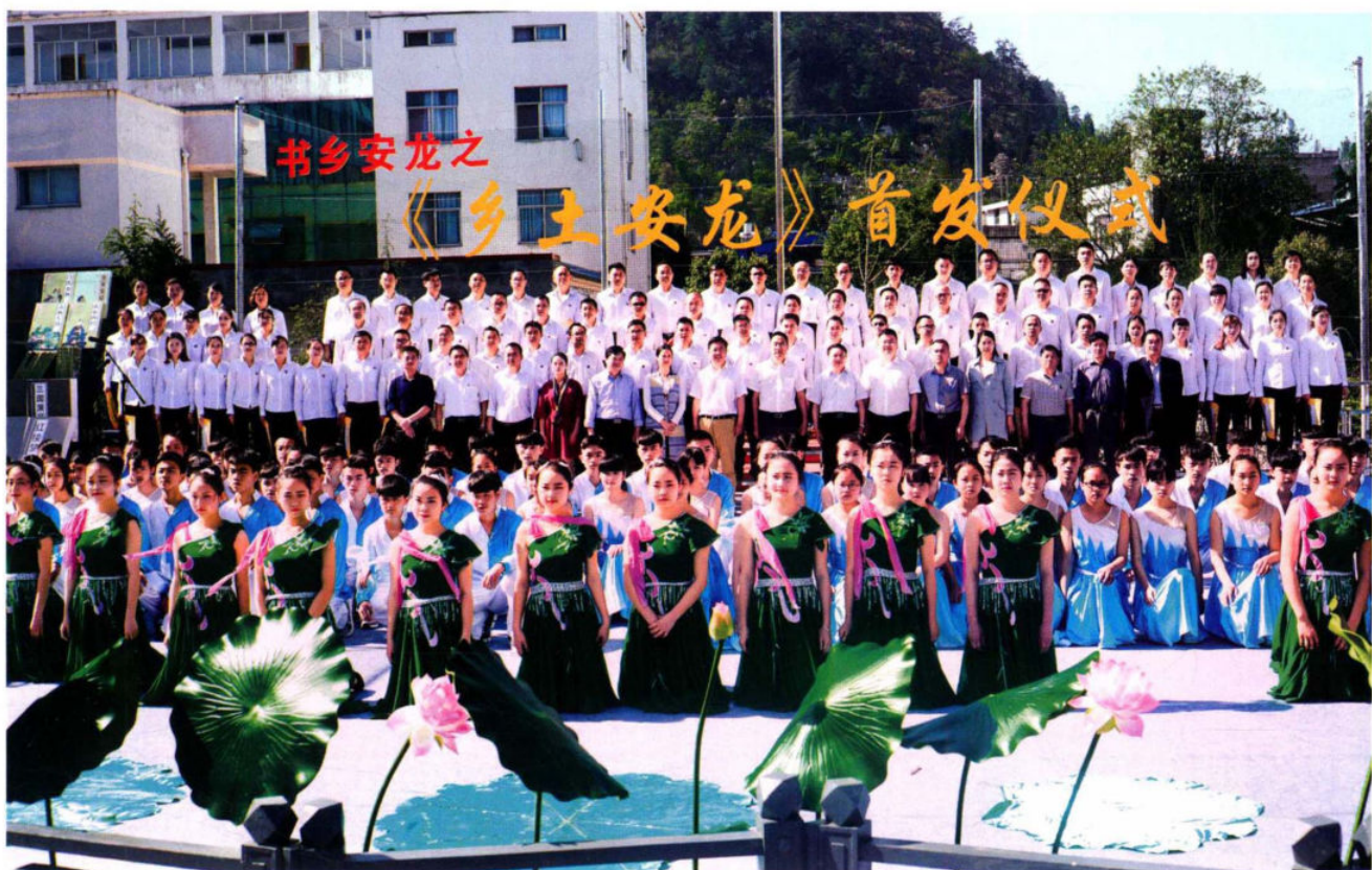
本土教材《乡土安龙》丛书发行仪式与会人员集体合影