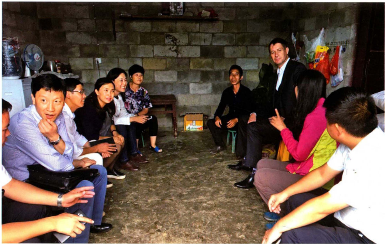
国际红十字会官员在笃山镇纳黑村考察