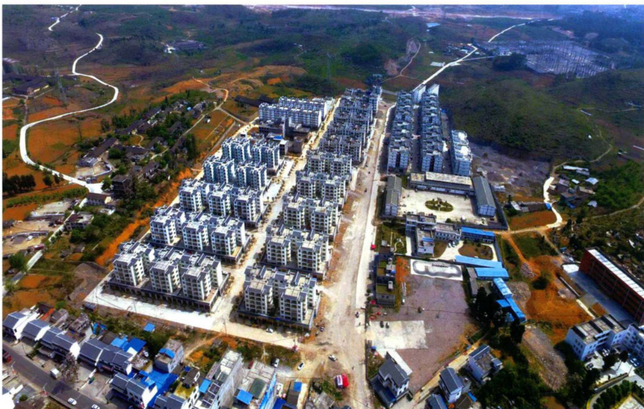
新桥镇宝山安置区俯瞰