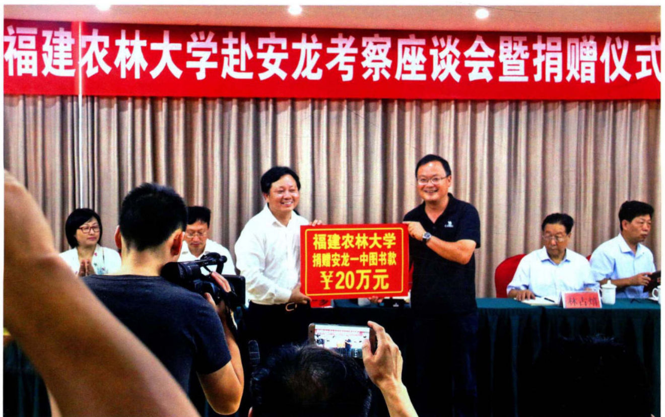
福建农林大学向安龙一中捐赠图书款 20 万元