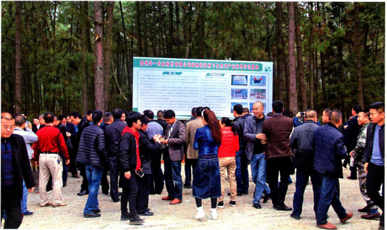
2017年3月28日，全省观摩会到钱相街道观摩点华一农业公司林下生态鸡产业扶贫基地参观。