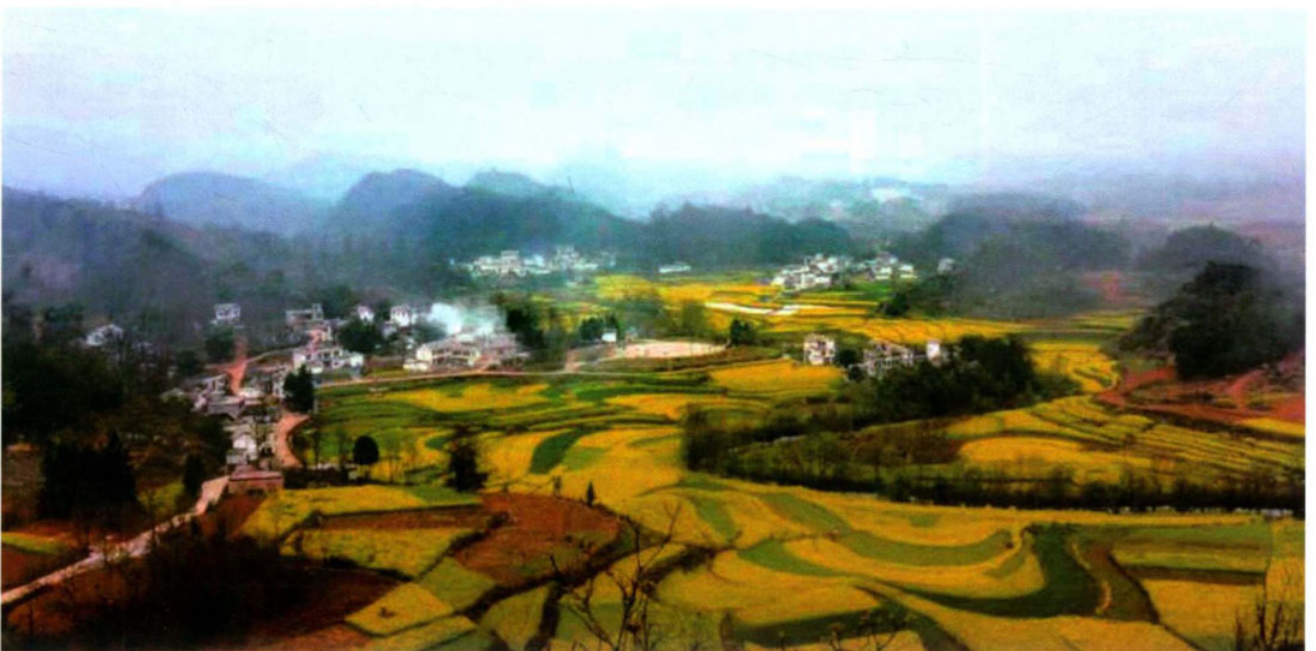
普坪镇香车河村田园风光