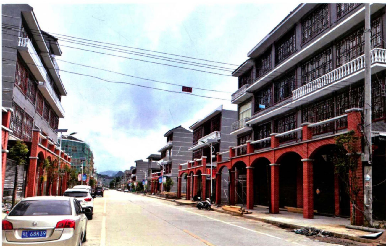
改造后的普坪镇街道