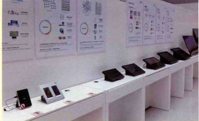
▶ 京东方产品展厅一角。