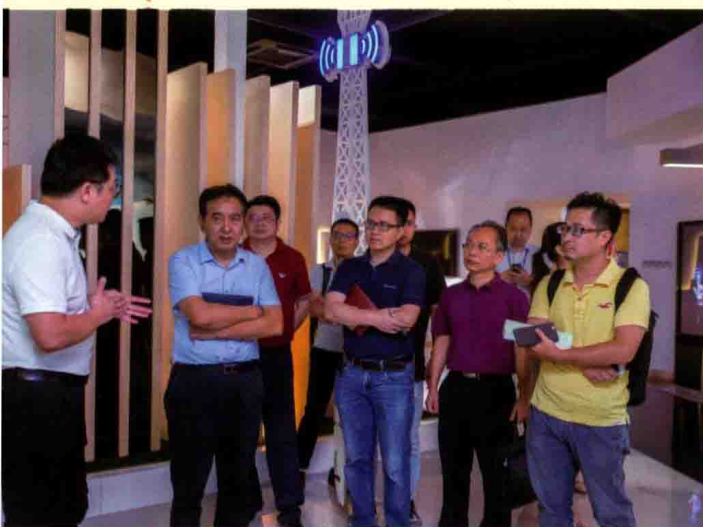
证券时报采访团参观三 安光电展厅。