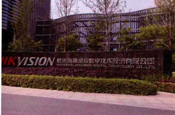
海康威视公司大门口。◀