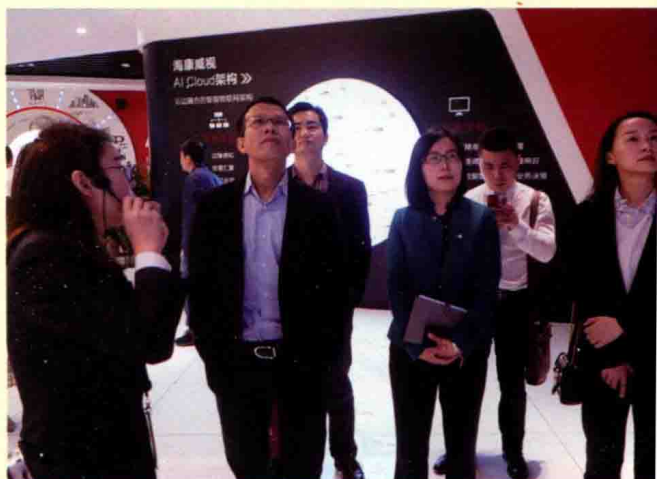
证券时报采访团参观通威股份。◀