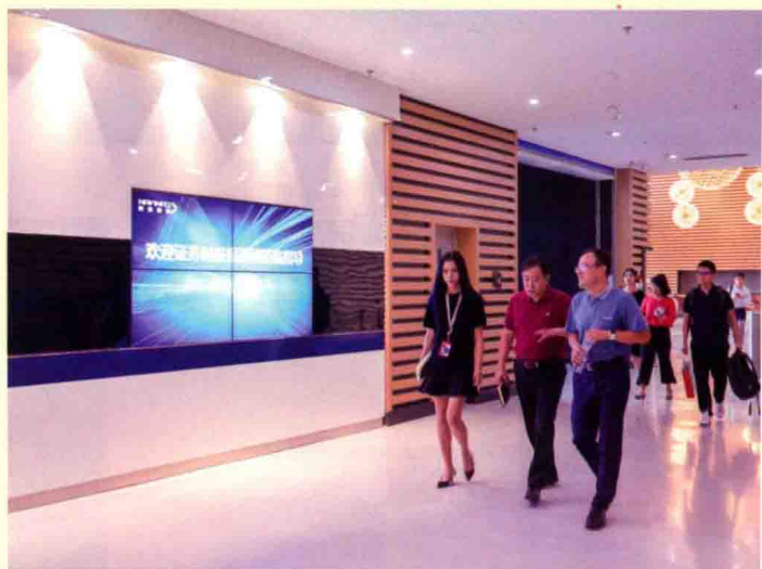
证券时报采访团参观四 维图新展厅。