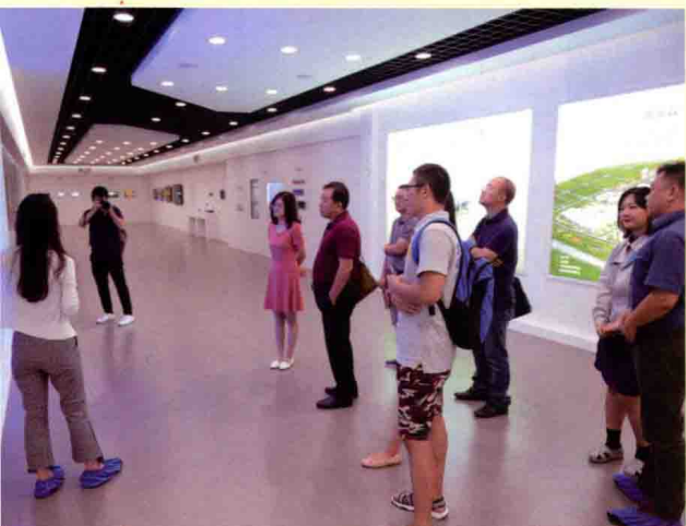
证券时报采访团参观京东方展厅。▶