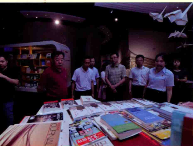
证券时报采访团参观太阳纸业展厅。