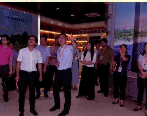
证券时报采访团参观阳光电源展厅。◀