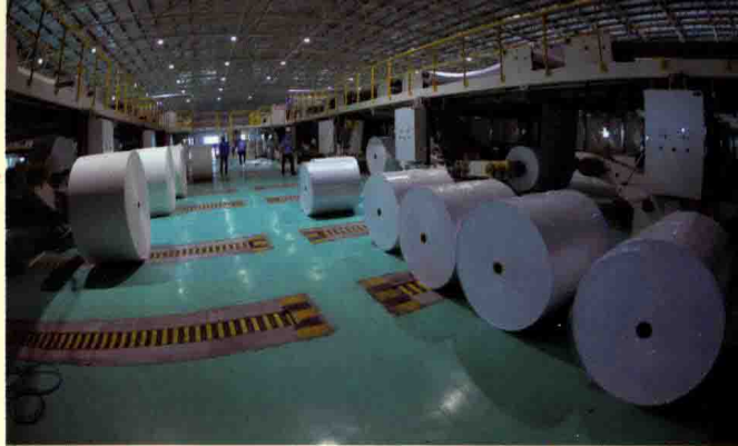
▶ 太阳纸业生产车间。