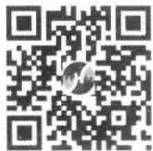
微信扫码立刻刷题

本书名为600题,但未止步于600题。本着传播知识与爱的宗旨,我们还为你准备了线上海量题库,不用关注不用注册,省去繁多步骤。微信扫码,立刻刷题。微信扫码,还可下载初始条件系列讲义。