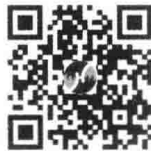
微信扫码下载初始条件系列讲义