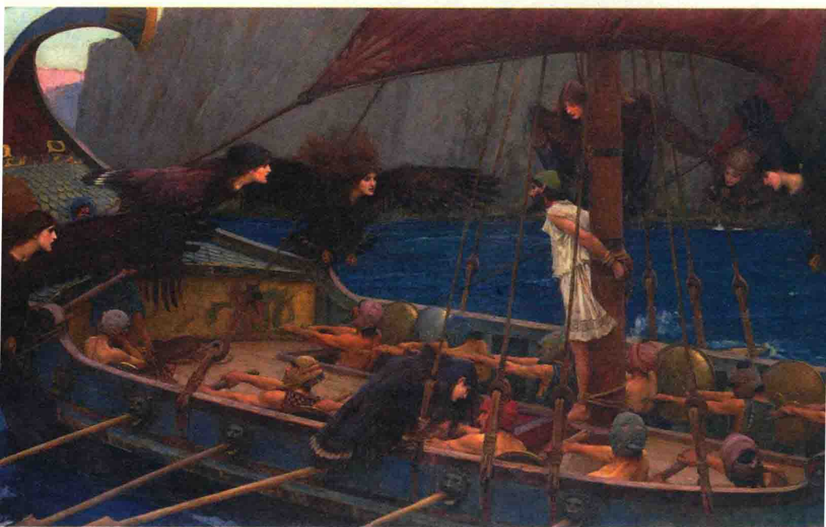
《奥德修斯与塞壬女妖》，1891年，[英] 约翰·威廉姆·沃特豪斯