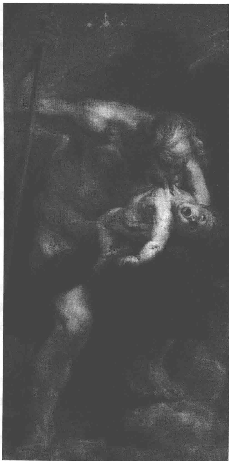
克洛诺斯吞噬波塞冬