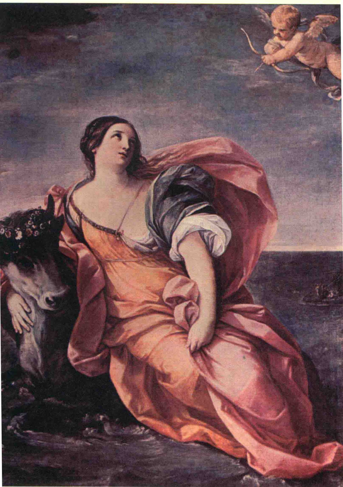
《宙斯与欧罗巴》1637—1639年，[意大利] 圭多雷尼