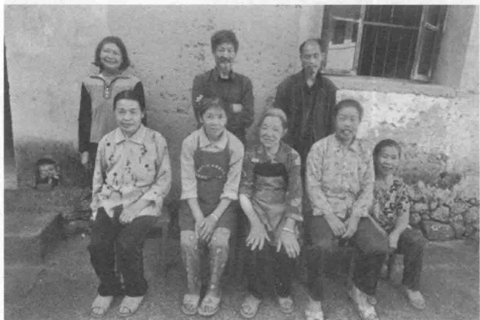
距离武义县城 60 多公里的界村，长住村庄的村民不到 20 位，几乎全部都是 60 岁以上的老人。

武义县城西南方向 60 多公里，便是界村所在地。因为途经山路，车速上不去，行驶需要一个半小时。