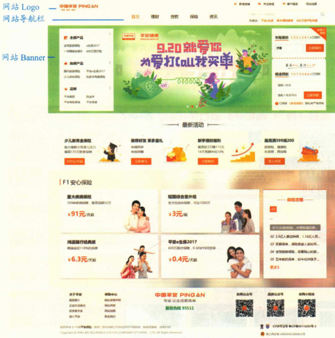
图 1-3 网页的版面构成