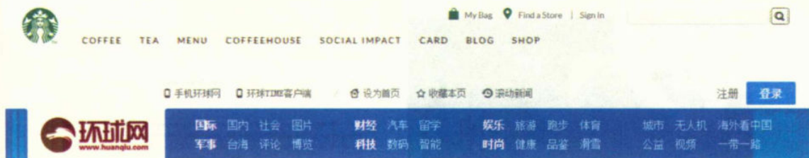
图 1-5 不同类型的导航栏

网站导航栏用于链接网站的不同页面,引导用户浏览网站的不同信息,如图 1-5 所示。对于内容不多的网站,可使用简洁、清晰的导航栏;综合类网站由于栏目多,信息量大,通常会将导航栏分成多行,便于访问者了解网站的内容并浏览。