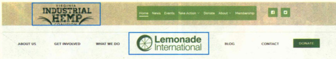
图 1-4 网站 Logo