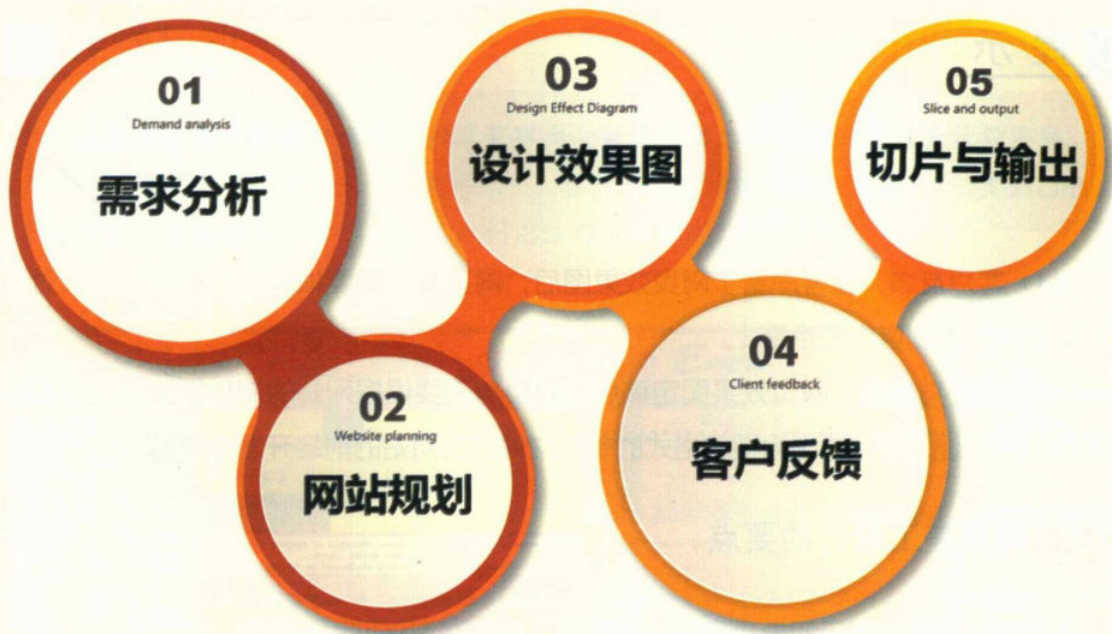
图 1-1 网页美工设计的流程

(1) 需求分析 。网页美工与项目负责人一起与客户沟通，了解客户的需求，并为客户提供网站建设和网页设计的参考建议。可向客户提供或让客户提供至少 2 ~ 3 个与客户需求同类的参考网站，让客户说明他对这些网站的看法，以便了解客户的意图和品味。对客户需求的细致了解和分析可让网页美工在设计时少走弯路。