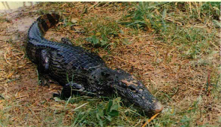
● 长兴保护区扬子鳄