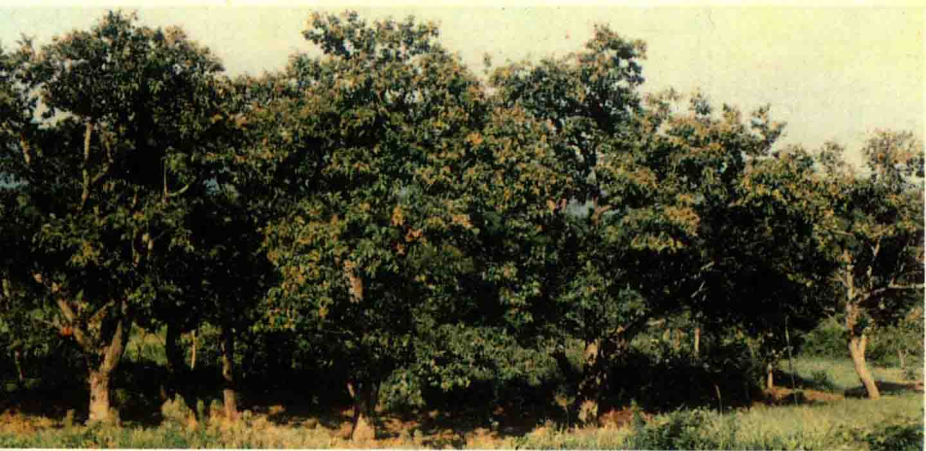
● 桂花飘香 (白雀乡建国村)