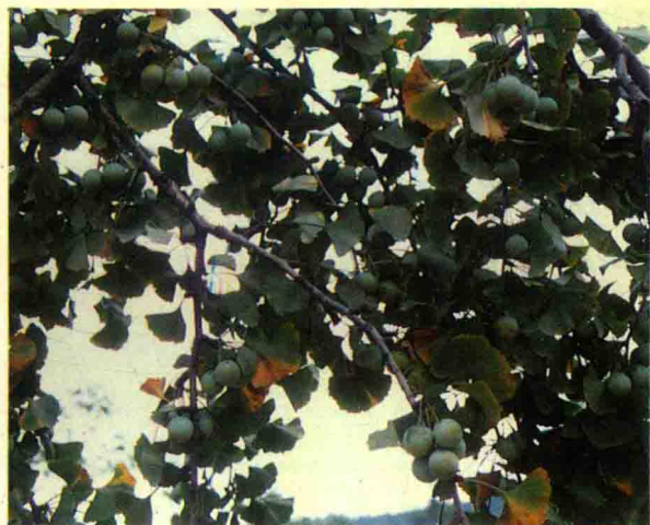
● 果实累累的银杏枝条