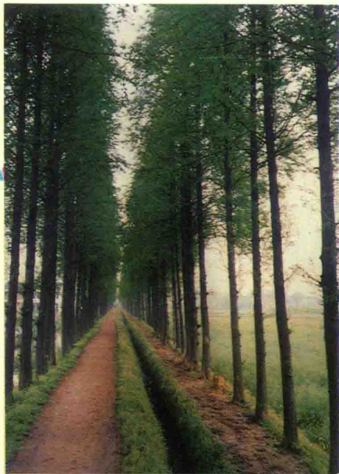
● 平原绿化(机耕路绿化)