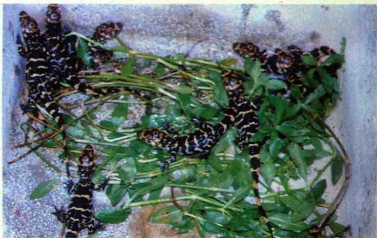
● 生下不到一个月的小宝贝。