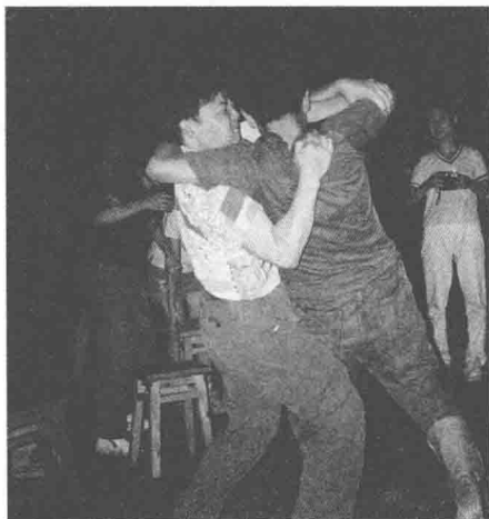
◇ 1999年夏天，和学生摔跤

三十多年的教育经历告诉我，真正有效的教育具有不可复制性。不但不可复制别人，也不可复制自己。无论我教好过多么顽劣的学生，其经验完全不可能百分之百地重复在我以后所遇到的新的“后进生”身上。