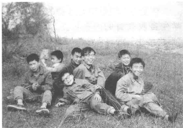
◇ 1982年，在乐山一中工作时和学生在郊外