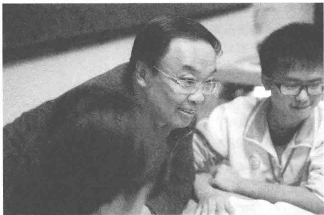
◇ 在课堂上和学生交流对话

爱，是教育的前提。但是，对“后进生”来说，这种“爱”应该是真诚的。换句话说，教育者对“后进生”的爱，决不应是为了追求某种教育效果而故作姿态的“平易近人”，而是教育者真诚的人道主义情怀的自然流露。