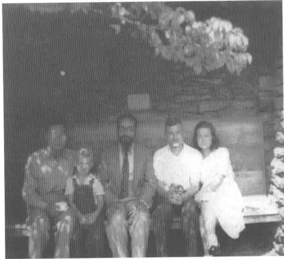
1947年冯友兰、冯锺辽与德克·卜德 (Derk Bodde) 及其家人在一起。卜德是两卷本《中国哲学史》的英译者和《中国哲学简史》英文原版的校订者。