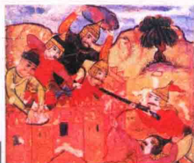
帖木儿的军队围攻赫拉特