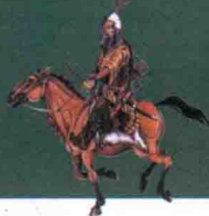
帖木儿军在金帐汗国的白帐草原上围猎

帖木儿在位30多年期间，帝国疆域空前辽阔，其领土西起幼发拉底河，东至锡尔河和印度德里，北抵高加索，南临波斯湾，建立起一个仅次于蒙古的大帝国。