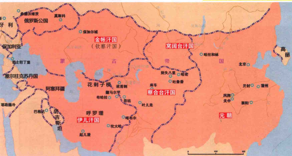
蒙古帝国疆域及四大汗国划分图

成吉思汗孙子旭烈兀西征后所建，疆域东起今阿姆河，西至地中海，北自高加索，南抵印度洋。是沟通亚欧两洲经济文化的重要枢纽之一