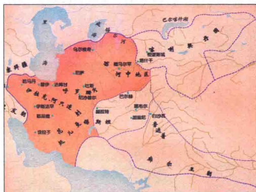
喀喇契丹国与花刺子模国

受塞尔柱帝国统治，1194年反抗打败塞尔柱帝国后尽取其属地。摩诃末（1200年~1220年在位）时期成为中亚的主要帝国。1220年被成吉思汗所灭