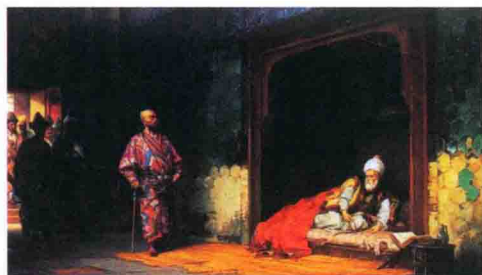
被俘的奥斯曼帝国苏丹巴耶塞特