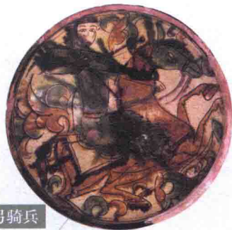
萨曼王朝弓箭骑兵

古粟特人后裔，建立萨曼王朝，定都布哈拉，统治着河中地区。随后吞并呼罗珊，占领怛逻斯，其影响远达喀什噶尔。999年，被突厥人的伽色尼王朝、哈拉汗朝瓜分