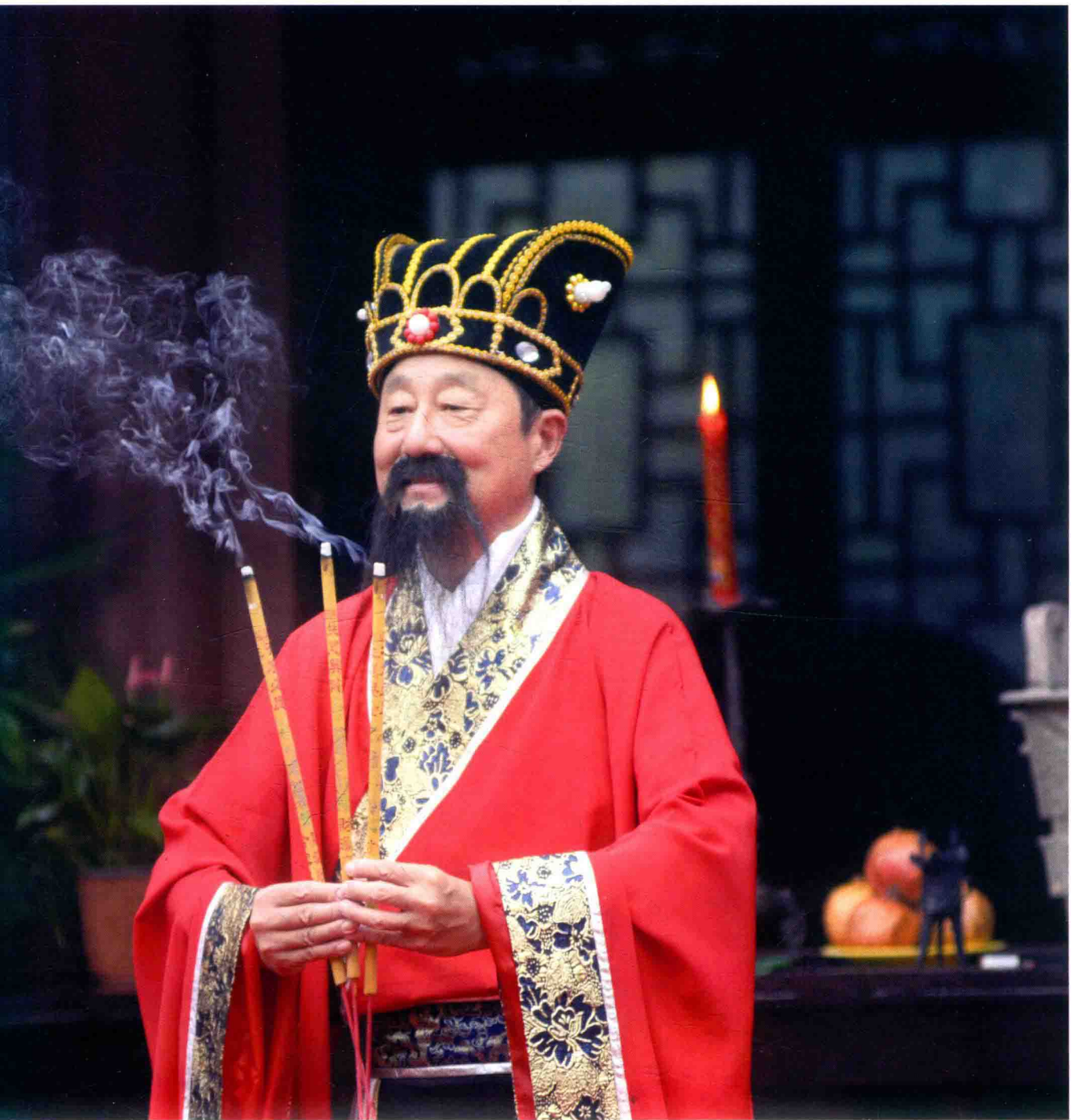
身着汉服的主祭员按照古法明烛上香