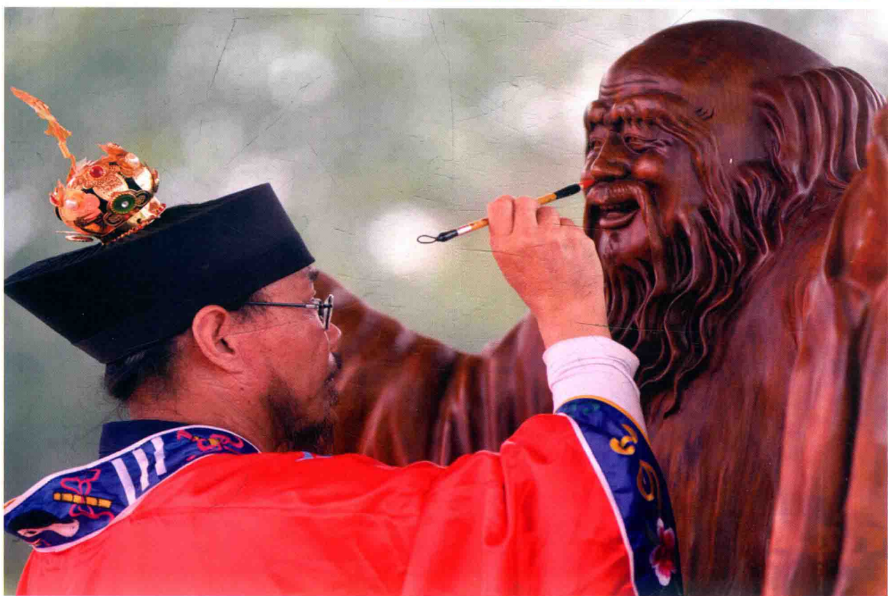
为老子雕像开光的道长