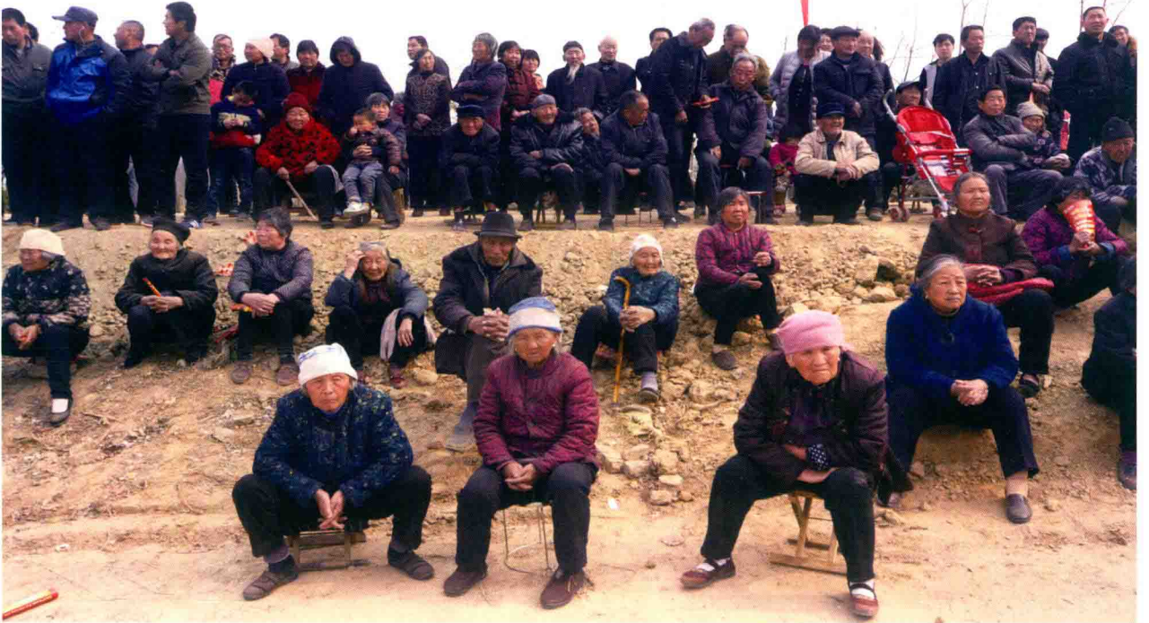
参加老子祭拜活动的村民