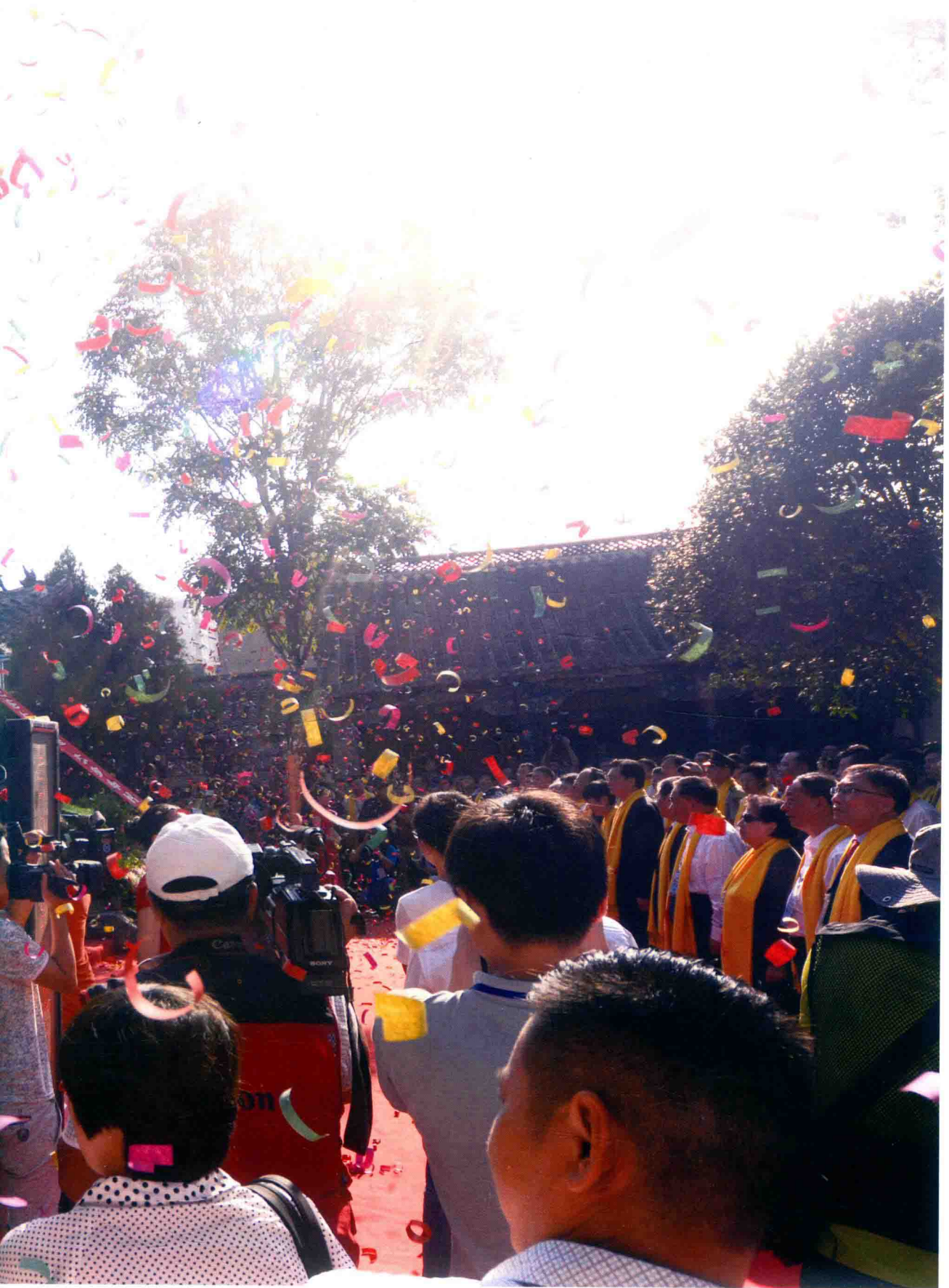
2015年9月9日，绽放的礼花将祭祀大典气氛推向高潮。