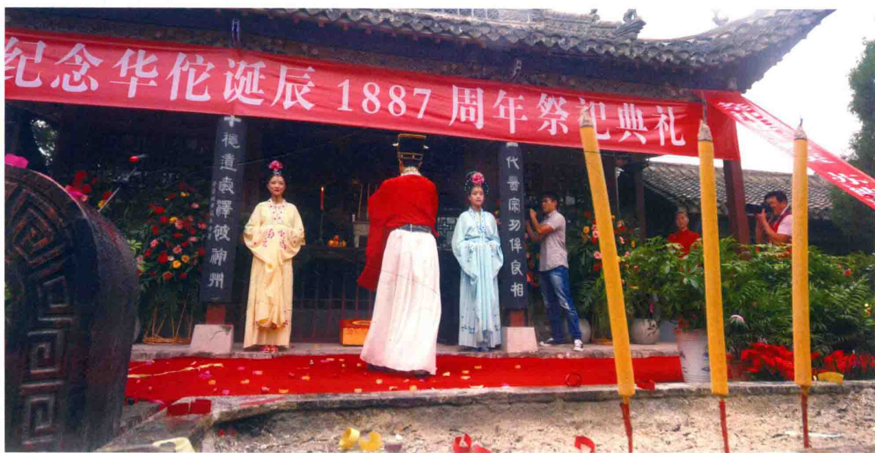
2014年9月9日，庄严肃穆的祭祀典礼。

“明烛”“上香”“祭酒”，遵照古风的祭祀礼节依次进行，祭祀大典现场香雾缭绕，磬乐幽雅。恭诵祭文，历数神医功德，展望药都美好宏图，表达百姓安康的愿望。现场嘉宾和观礼群众向着华佗像深沉低首，行三鞠躬礼，寄托对华佗的敬慕之意。