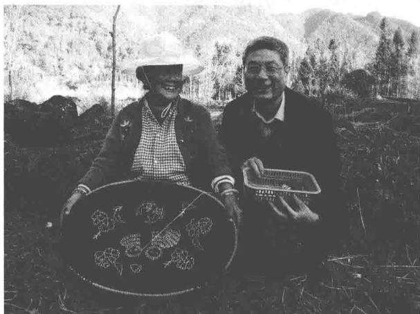
丨上图 作者在火山石围起来的古村落前