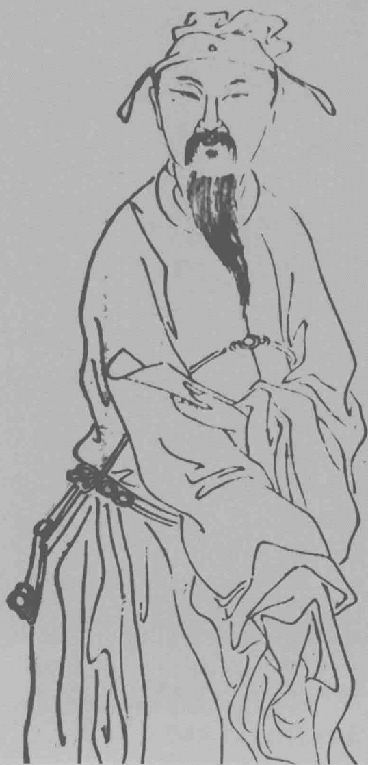
孫蕢遺像 (清道光十年刻本《西庵集》卷首)