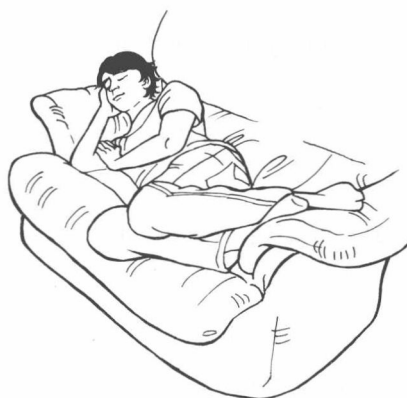
She is tired.