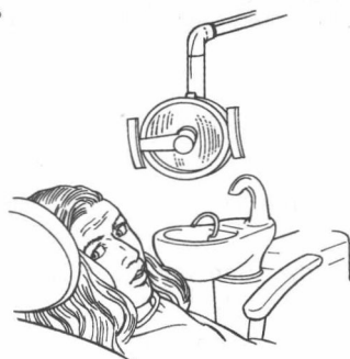
She is nervous.