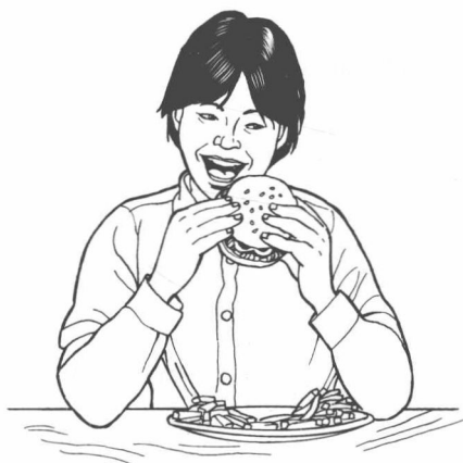
He is hungry.