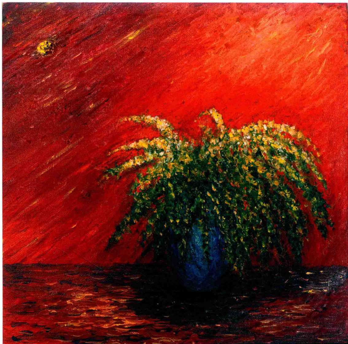
↑ 中秋的月光 2015.9. 南泉 (李爽) 布面油画 oil on canvas by Nan Quan ( Li Shuang )