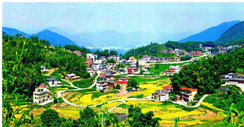
福建省永春县农村公路新貌