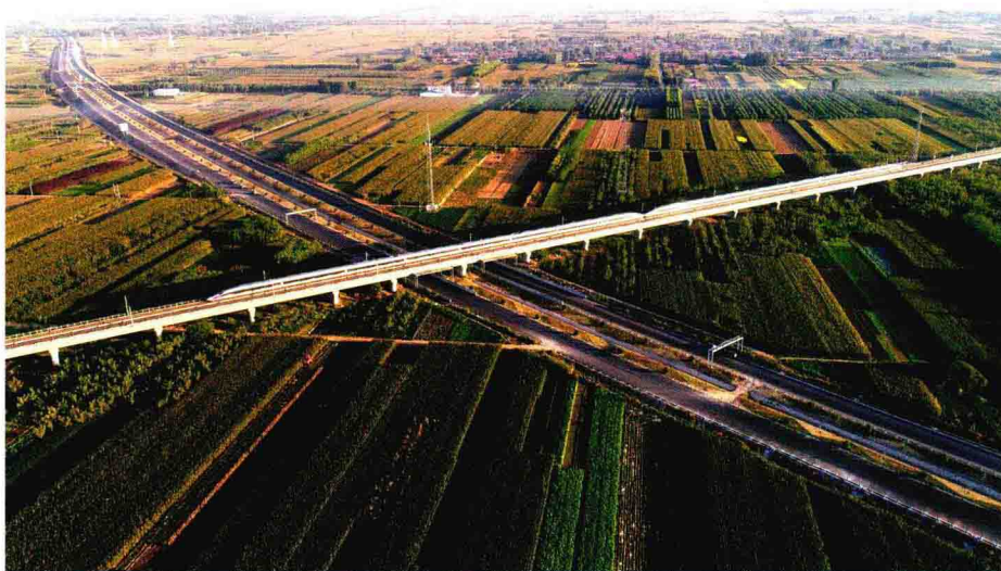
京广高铁跨越曲港高速公路