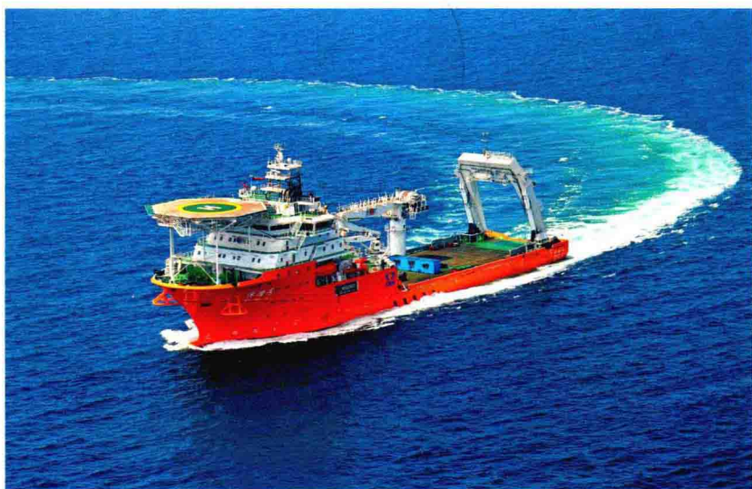
国内首艘 300 米 饱和潜水支持母船