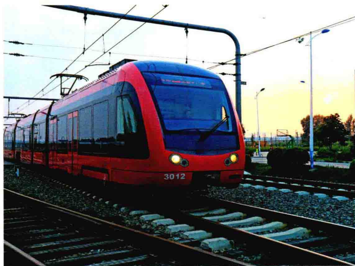
长春轻轨线路，从城北到城南只需 30 分钟