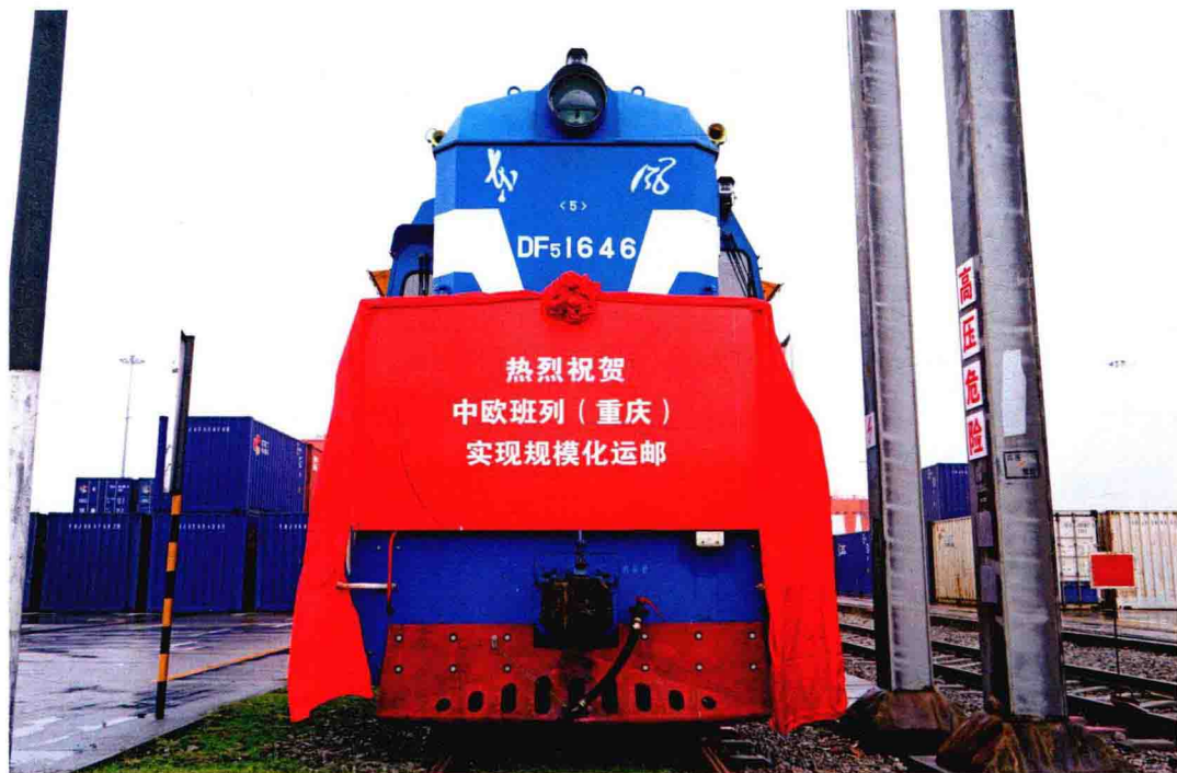
2017 年 11 月，中欧班列（重庆）实现规模化运邮