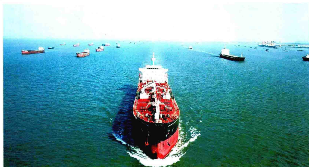
长江南京以下 12.5 米深水航道二期工程正式试运行