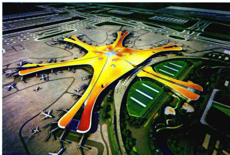
北京大兴国际机场航站楼俯瞰图