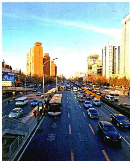
北京三环路公交专用道高峰期运行秩序良好