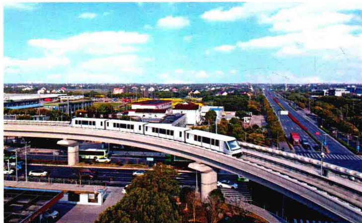
上海首条无人驾驶轨道交通浦阳线开通试运营