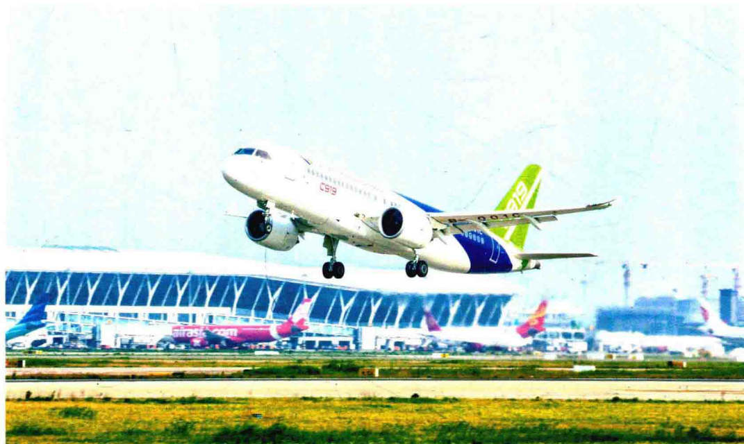
C919 大型客机飞上蓝天