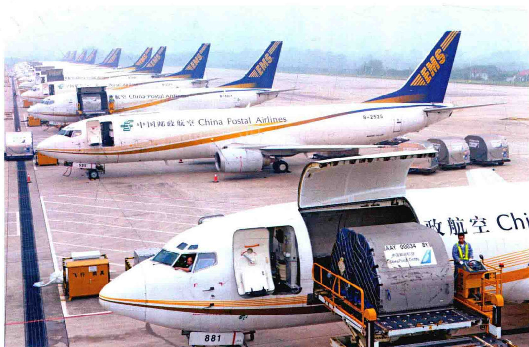
截至 2017 年末，中国邮政拥有专用邮政运输飞机 33 架，航空邮路 2709 条