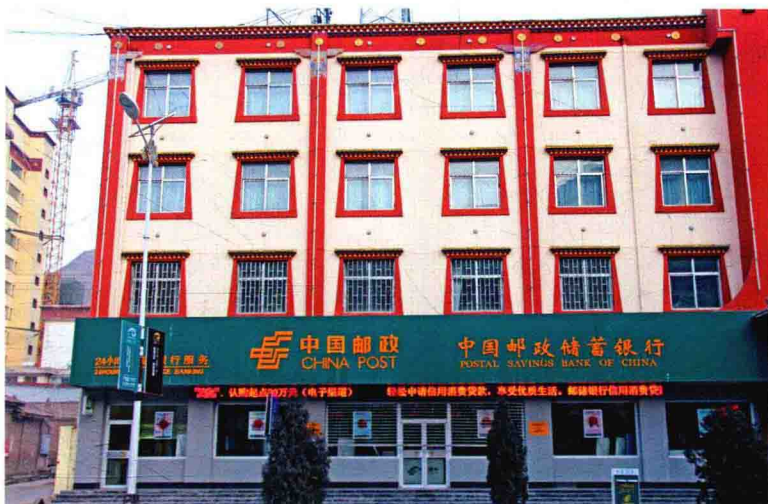
甘肃省甘南州夏河 县邮政分公司