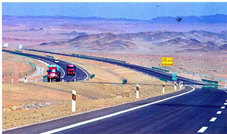
世界上穿越沙漠最长的高速公路——京新高速公路