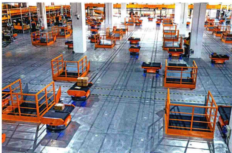
中国邮政速递物流 华中（武汉）陆运中心 的智能机器人