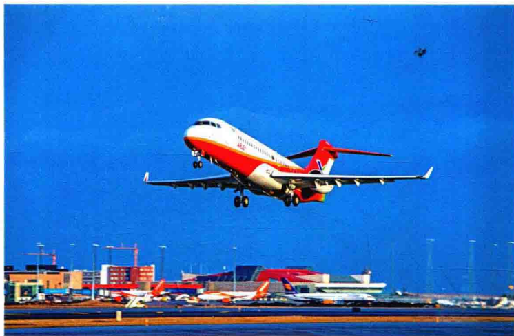
我国自主研制的 ARJ21—700 飞机 104 架机 2018 年 3 月 26 日在冰岛试飞