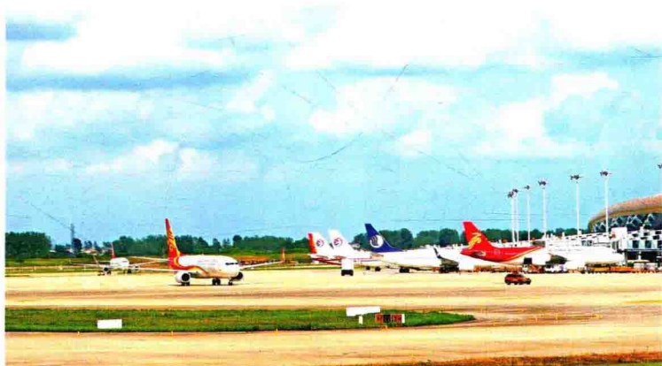
2017 年安徽成立国内首家省级民航城市候机楼联盟