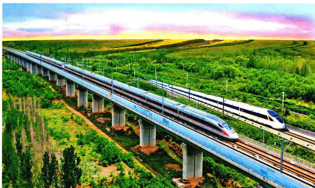
“复兴号” 奔驰在广袤的大地上