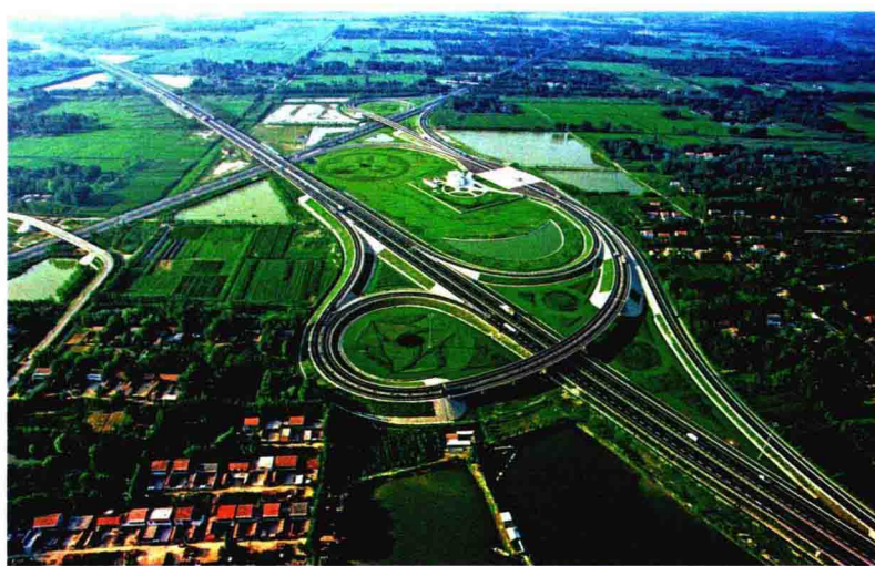
京沪高速公路江苏段