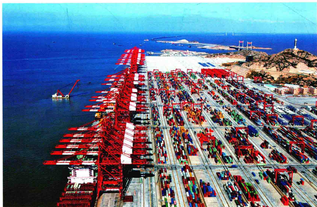
上海洋山深水港区