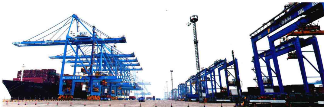
青岛港全自动化码头作业现场