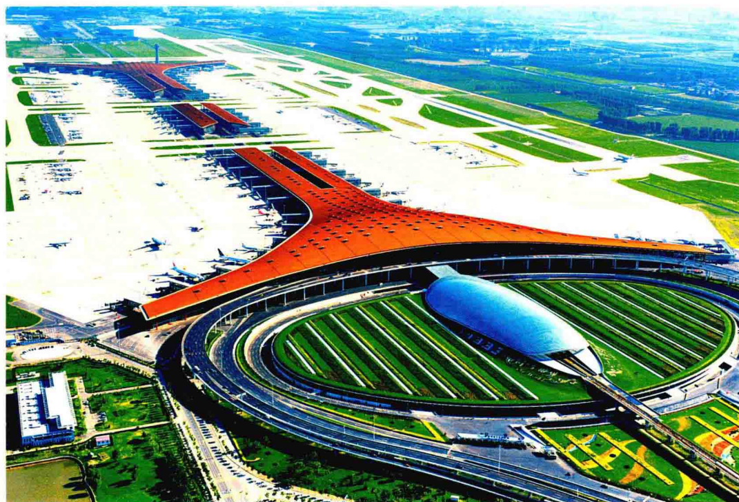
北京首都国际机场 3 号航站楼和飞行区