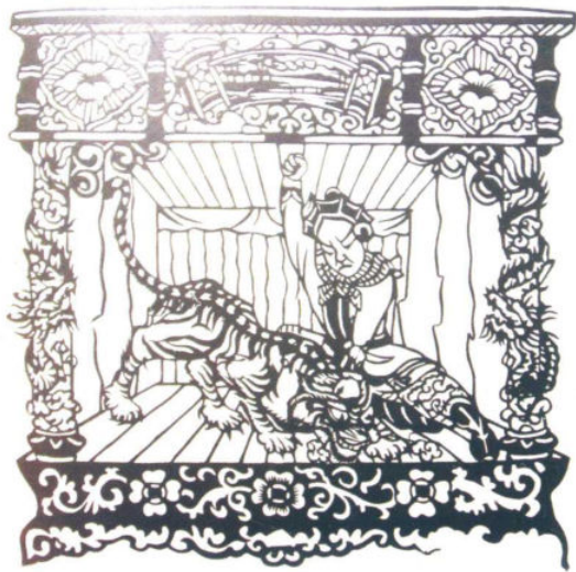
陈金《武松打虎》