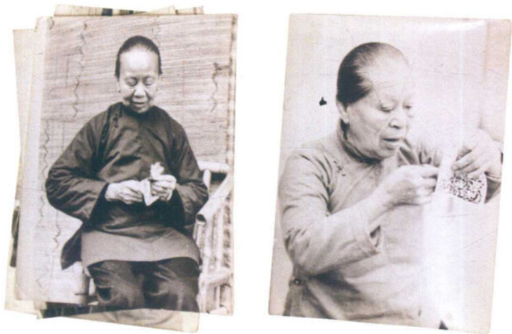
漳浦剪纸花姆老照片

漳浦是福建省漳州市南部的一个沿海县，漳浦传统的民间剪纸主要以日用的各类礼花、供品花，以及绣样为主，带有独特的地方民俗色彩，具有浓郁的生活气息。《漳浦县志》记载“元夕自初十放灯至十六夜，乃已神祠家庙，或用鳌山