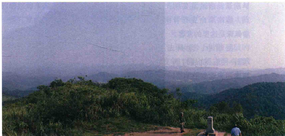
▲法卡山之巔南望

山脊划界，已协商解决了边境问题。这种居强忍让、理性客观之态度，彰显中华民族追求和平之理念与智慧。