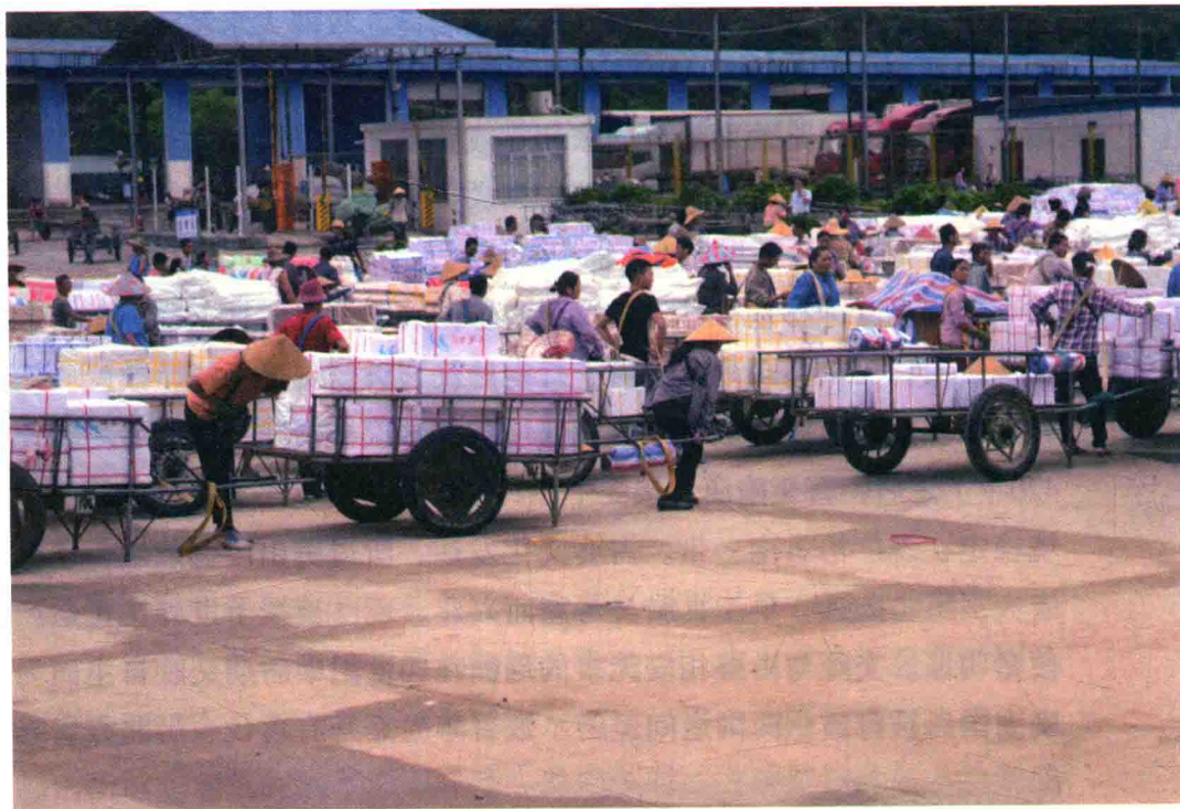
▲ 里火口岸前的待商越民

凌弱的历史。李朝时安南数次对占人用兵，陈、胡朝时安南取得优势地位。1306年，陈朝玄珍公主嫁给占王制旻，制旻将顺北一带作为聘礼献与陈朝，但由于占王死玄珍公主未殉葬违反占人祖制，两国反目，陷于领土争夺战之中。胡朝之后，黎利清化起义建立黎朝，仍兵锋直指南邻。黎朝中期陷入内乱，数第二次北郑南阮的军事割据历时最久，近两百年。阮主占据顺化并定居于越中南部。1697年，阮灭亡占婆，将占国宗室赶到平顺一带，只保留三块自治领土，由占人三首领据之。此时，广南阮主地开始接壤高棉。待建立阮朝后，又于19世纪中叶借故将占人三府收回，占人所有之行政权均归终局。我曾遍访越南部，仍见该地有许多占人庙宇与陵塔存在，尤以藩切南的墓塔为最。中国