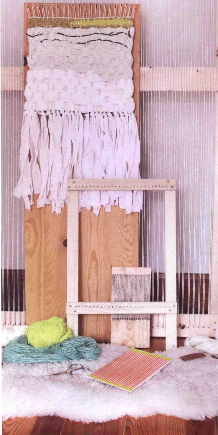
图中织布机从前至后分别为：硬纸板织布机、可调式框架织布机、利用废木板自制的迷你织布机、利用废木板自制的大号织布机和超大号框架织布机。

面对不同类型的织布机，新手究竟应当选择哪一种呢？实际上，我们多数时候需要根据不同种类的作品来选择不同类型的织布机。