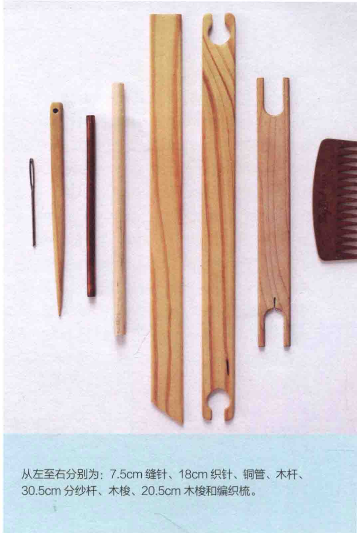
从左至右分别为：7.5cm 缝针、18cm 织针、铜管、木杆、30.5cm 分纱杆、木梭、20.5cm 木梭和编织梳。

编织梳： 宽度不一，在编织过程中用于逐行整理新完成的纬纱。市面上销售的木质或亚克力编织梳款式精美多样，但也可使用手指、叉子或杂货店售卖的普通发梳来代替。