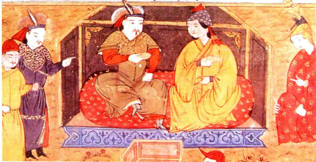
旭烈兀汗与王后在一起

در روزی غایت سعود آنرا بر افراشت و مجلس را با انواع تجملات بنا راستند و ملوک و خانان از این بدیده داشته مبارکی و طالع سعید بر تخت بنیاد و رسید کامیاباری نشست و هر این و همراگان و او را که حاضر بودند و تمامت ارکان دولت و احیان حضرت و ملوک و رجایام اطراف که جمع شده آمدند و بر همین بنده رسایند و انالله