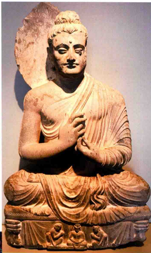
犍陀罗时期的佛像