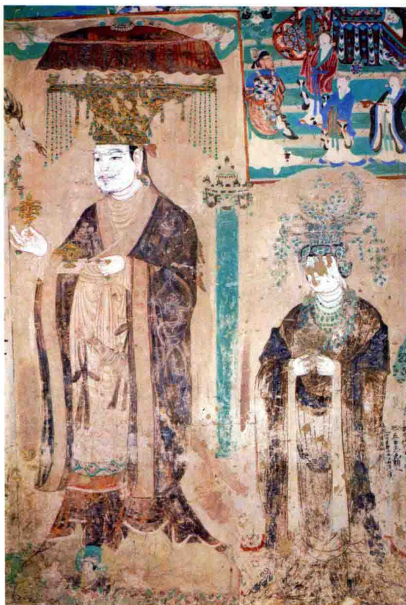
莫高窟第10窟中的于阗国王李圣天及其王后的画像