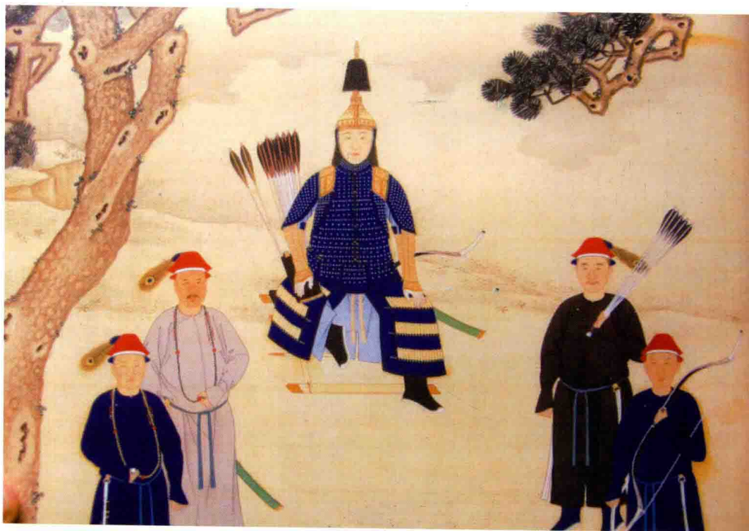
戎装带弓箭的康熙皇帝