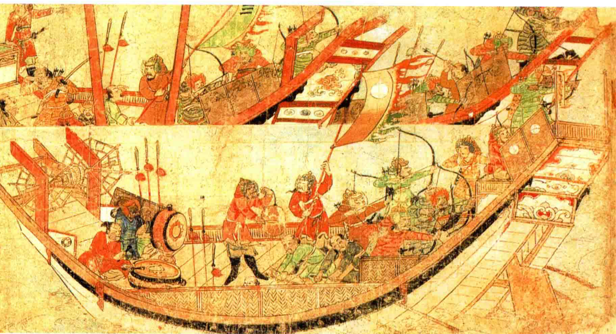
蒙古士兵和日本武士在船上对战的情形