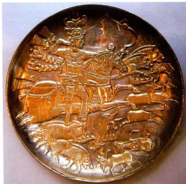
波斯的镀金银盘， 刻画的是波斯萨 珊王朝一位国王 狩猎时的情景