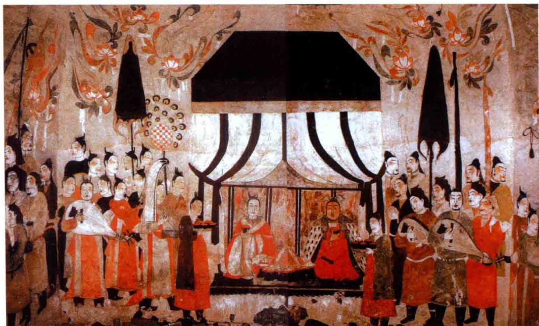
2002年发现的北齐时期徐显秀墓中的壁画