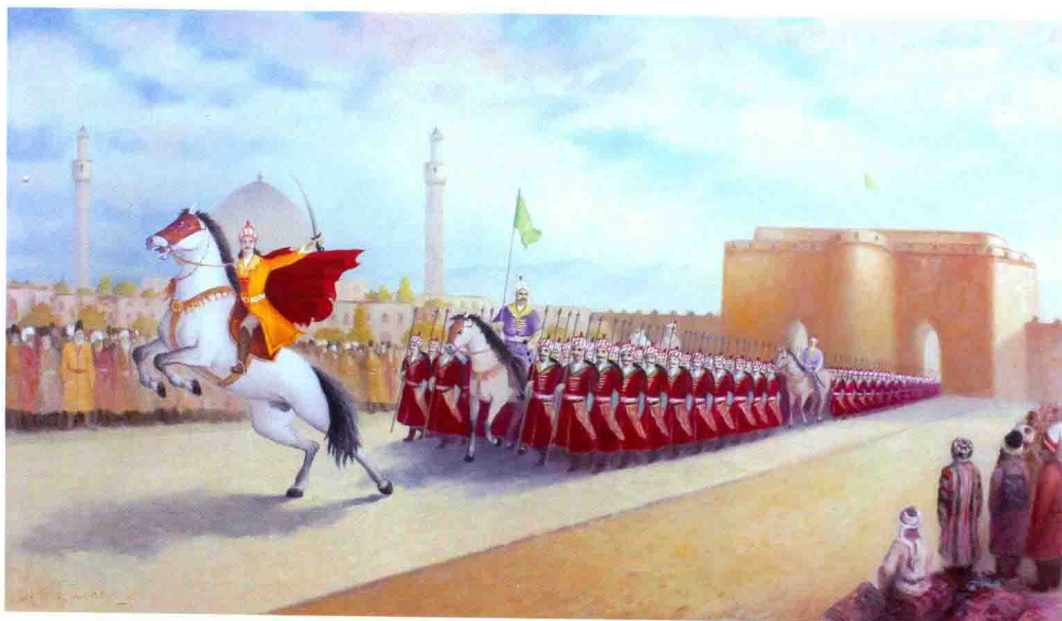
1502年，波斯萨非王朝的创立者伊斯玛仪一世率军进入大不里士城登基为汗