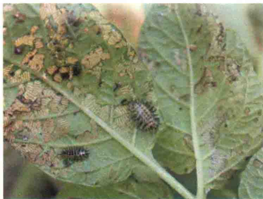
彩图63 马铃薯瓢虫幼虫