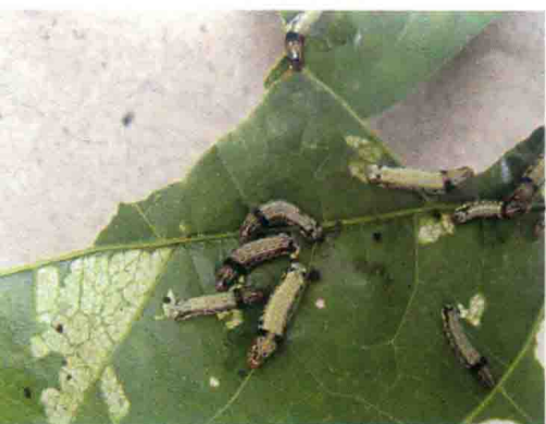
彩图56 甜菜夜蛾幼虫