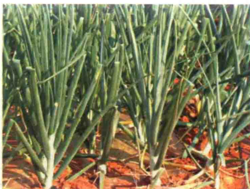
彩图41 洋葱未熟抽薹症状