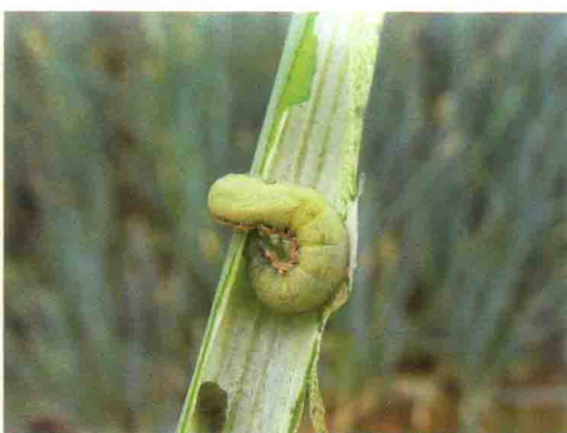
彩图57 甜菜夜蛾老熟幼虫