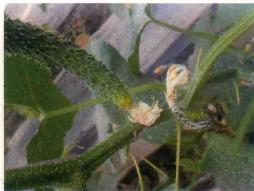
彩图29 黄瓜灰霉病症状