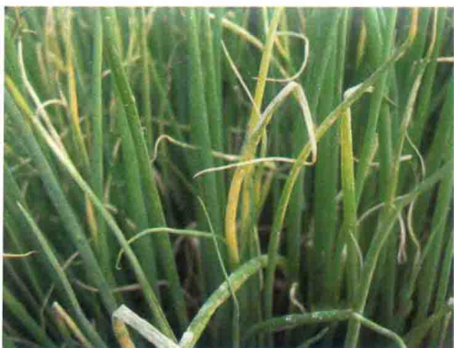
彩图40 洋葱霜霉病症状