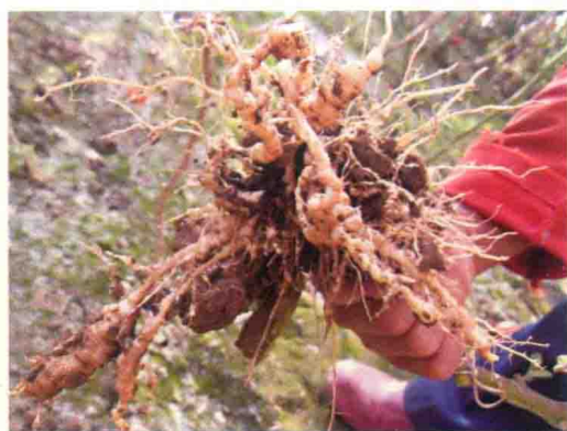
彩图20 番茄根结线虫病症状