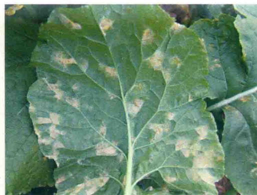
彩图33 萝卜霜霉病症状