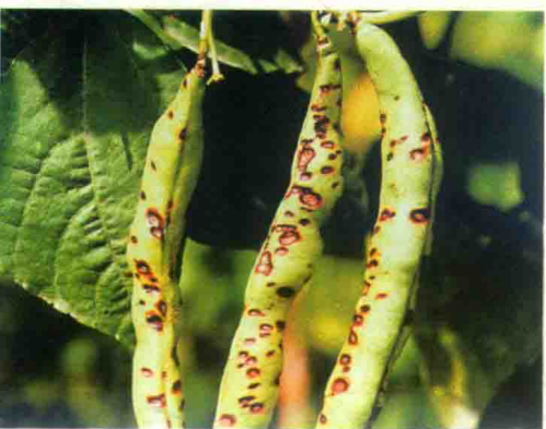
彩图26 四季豆炭疽病症状