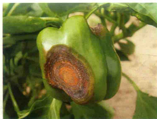
彩图22 辣椒炭疽病症状