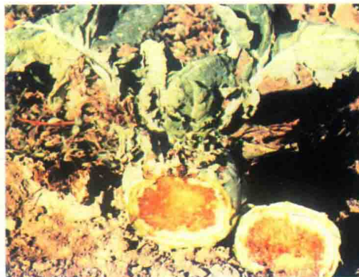
彩图14 球茎甘蓝黑腐病（球茎剖面）