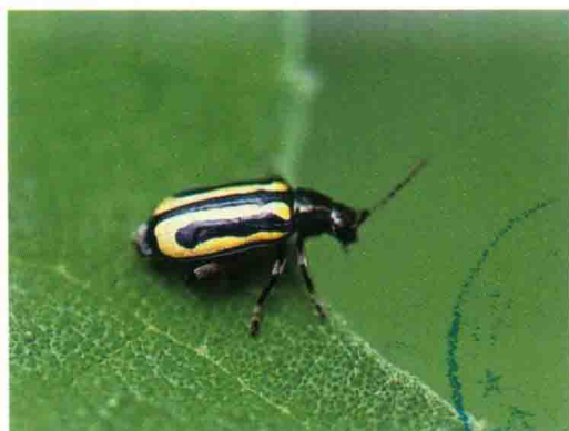
彩图65 黄曲条跳甲成虫