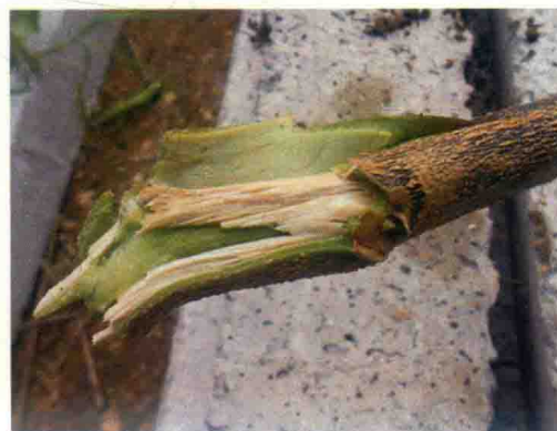
彩图16 茄子黄萎病症状（维管束褐变）