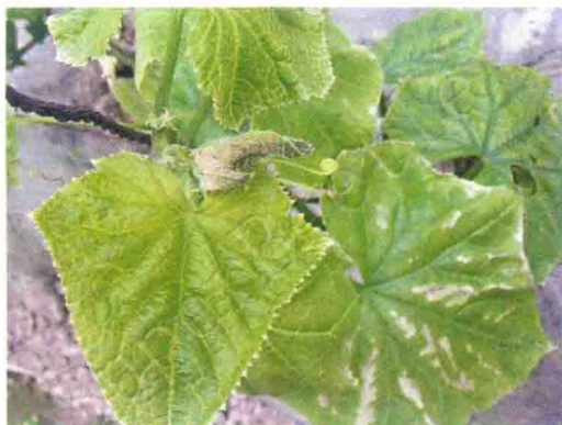
彩图2 黄瓜叶斑病症状