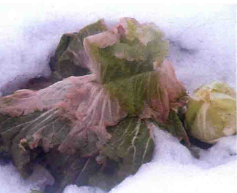
彩图1 大白菜冻害症状