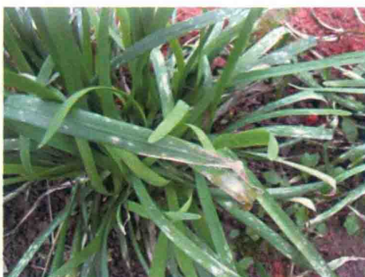
彩图43 韭菜灰霉病症状