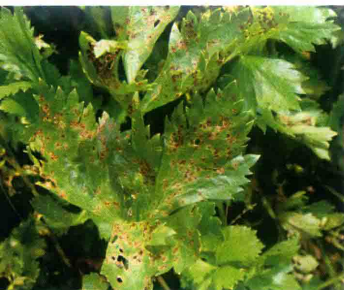
彩图11 芹菜斑枯病症状