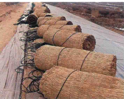
彩图7 覆盖材料草帘