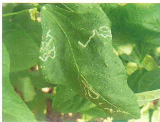
彩图62 斑潜蝇为害症状