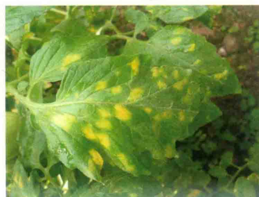
彩图17 番茄叶霉病症状