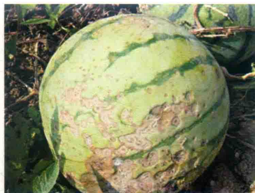
彩图31 西瓜炭疽病症状