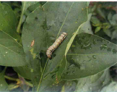
彩图58 斜纹夜蛾幼虫