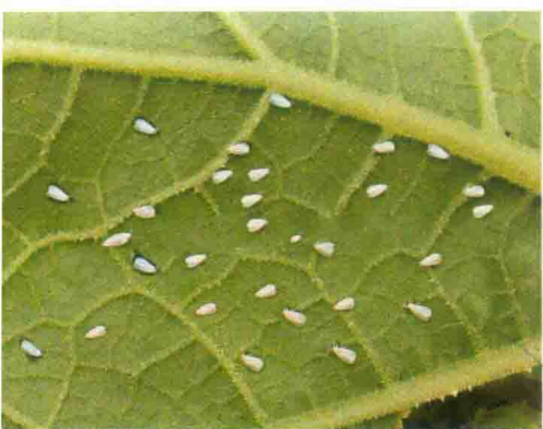
彩图19 烟粉虱为害状