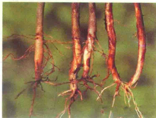
彩图25 菜豆根腐病症状