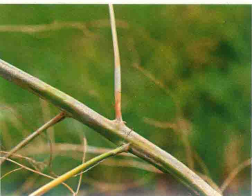
彩图36 芦笋茎枯病中期症状