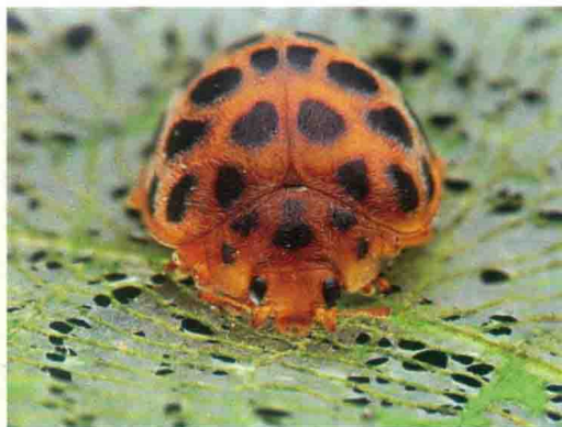
彩图64 茄二十八星瓢虫