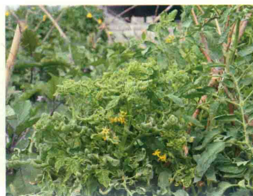
彩图18 番茄黄化曲叶病毒病症状