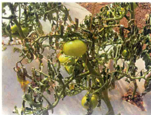
彩图4 番茄冻害症状