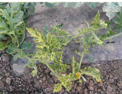
彩图30 西瓜病毒病症状