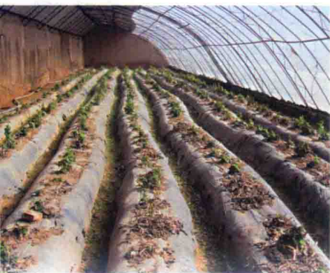
彩图3 幼苗萎蔫症状