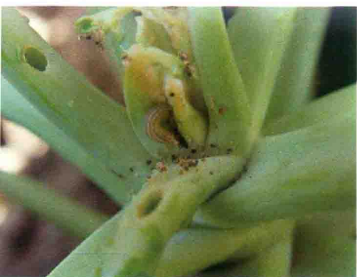
彩图54 菜螟高龄幼虫钻蛀为害菜茎