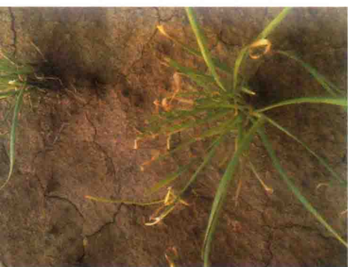
彩图44 韭菜疫病症状