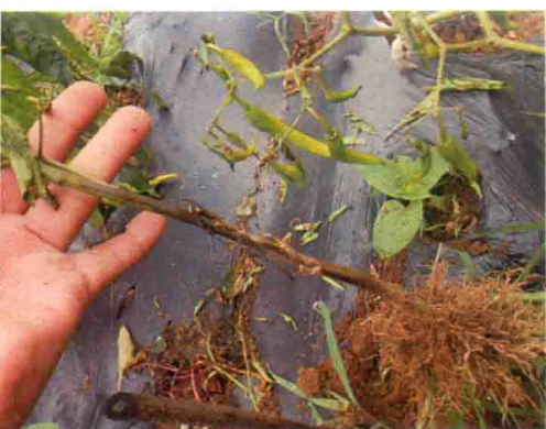
彩图21 辣椒疫病症状