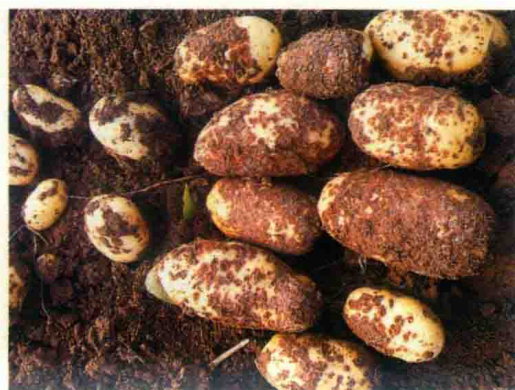
彩图35 马铃薯疮痂病症状