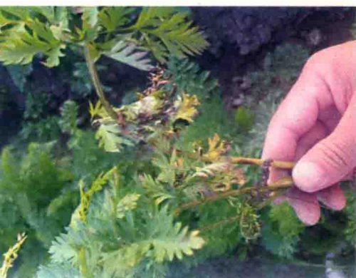
彩图34 胡萝卜黑斑病症状