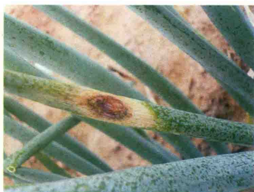
彩图39 大葱紫斑病症状