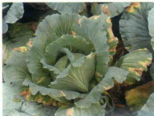
彩图13 甘蓝黑腐病初期症状