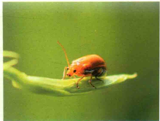
彩图68 黄守瓜黄足亚种