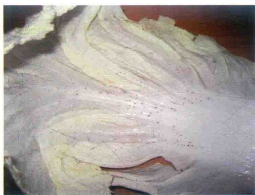
彩图10 白菜炭疽病症状