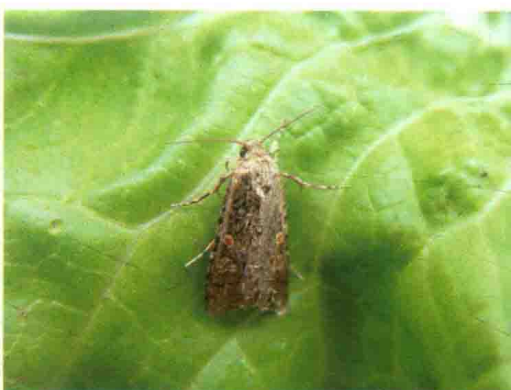
彩图55 甜菜夜蛾成虫