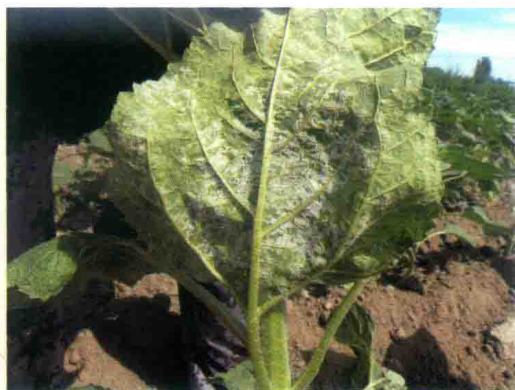
彩图8 大白菜霜霉病症状