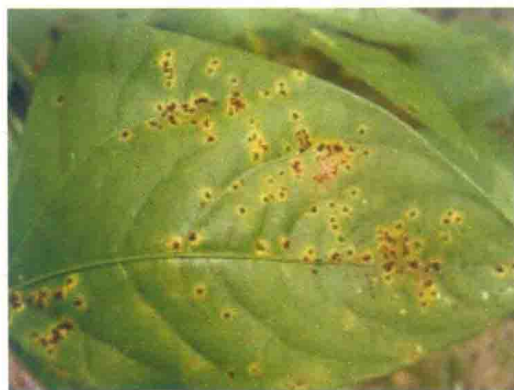
彩图23 豌豆锈病症状