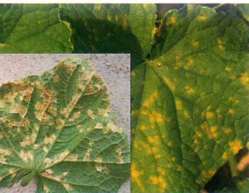
彩图28 黄瓜霜霉病症状