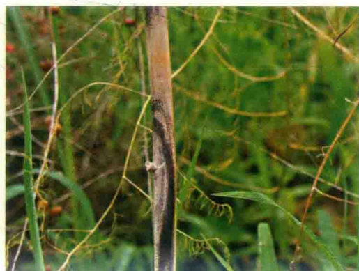
彩图37 芦笋茎枯病后期症状