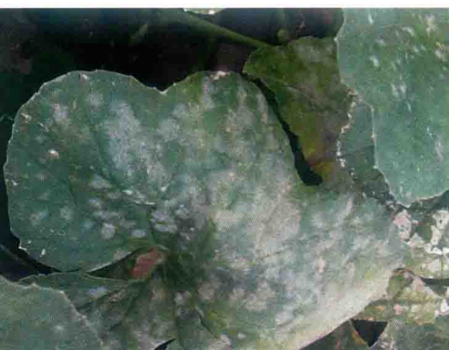
彩图32 甜瓜白粉病症状