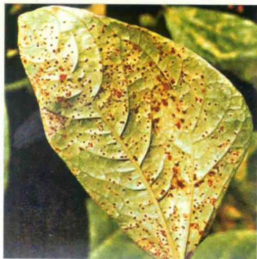
彩图27 四季豆锈病症状