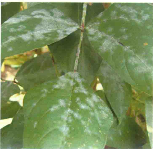
彩图24 豌豆白粉病症状