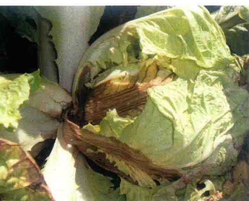
彩图9 大白菜软腐病症状