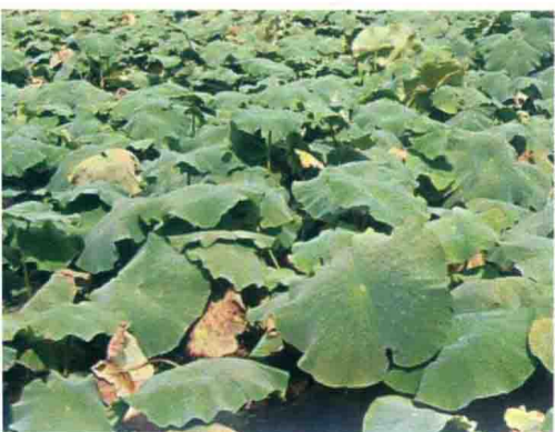
彩图38 莲藕腐败病症状