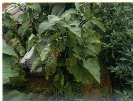
彩图15 茄子黄萎病症状（半边疯）