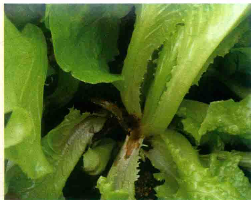
彩图12 莴苣菌核病症状