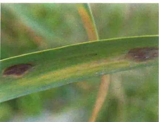
彩图42 大蒜叶枯病症状