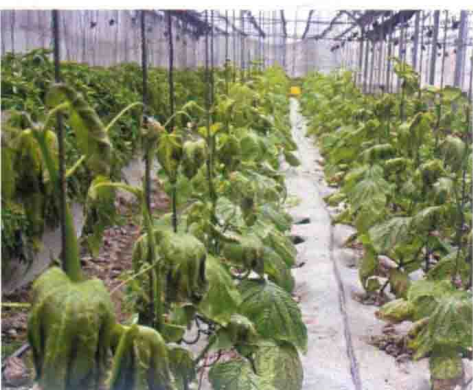
彩图5 整株枯死症状