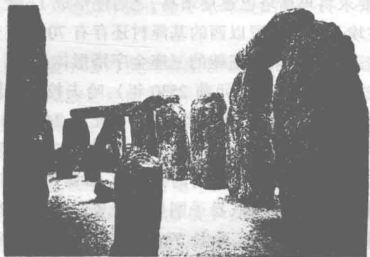
图2 史前大石桌(英国·公元前3000年)

板,形似“石桌”(见图2)。5000多年前的原始人是出于什么目的建造这些“石桌”,迄今还无人能作出正确的解释;对于当