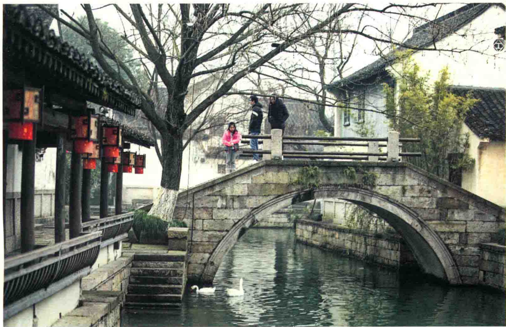
浙江，绍兴 / 临河的老桥下，几只白鹅在寒冷的水里嬉戏