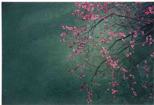
扬州，瘦西湖 / 繁花点缀湖水，泛着寒意的春光

很多年前，第一次坐飞机去桂林，从桂林坐大巴再去阳朔，惊讶于这里的山水突兀于眼前，竟然是自己从未见过的幻境。哪怕是在语文课本里读过，但身临其