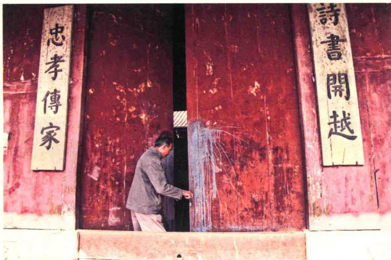
广州，花都/钱岗村 的老宗祠里，看门 的老人

当年的威严不改。老人用鸡毛掸拂去冬日积尘，红墙上探出几枝新开的桃花来，阳光恰又投了进来，疲惫的心情忽又活了起来。