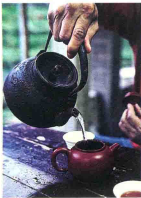
福建，安溪/村子 里的做茶人，用铁 壶炭火煮一壶去年 的秋茶

去安溪山中清净几日，恰逢有做茶的朋友带路，车子在山中盘绕几圈，山顶可见山坳处排列整齐的茶园和延绵的梯田。来到举溪村，茶园里的茶叶还未抽嫩芽，要想喝新的春茶，怕是来得太早了。午后仍然还能听到节日的爆竹声，去茶人家里小坐，久未居住的院子有点凋敝，但收拾一下就又亲切温暖了。傍晚我们几人坐在屋檐下煮茶喝，茶人喜欢用铁壶炭火煮水，专门把从日本带回的铁壶一路从厦门带了过来，仪式感十足。泡一杯