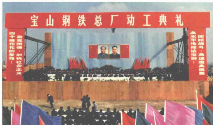
1978年12月，全国第一家现代化大型钢铁联合企业——上海宝山钢铁总厂正式动工兴建

来规模最大、投资最多的项目（总投资230亿元以上）——宝钢，在上海长江口畔打下了第一根桩，正式动工兴建，揭开了把宝钢建设成为我国第一个新型现代化钢铁联合企业的序幕。