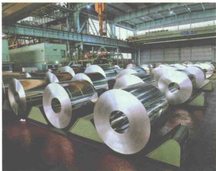
宝钢生产的精品钢材

“要好钢，找宝钢”。作为改革开放的产物，上海宝钢从成立之日起，就着力推进改革创新，大幅提升钢铁制造生产工艺技术水平，着力建成我国现代化程度最高、工艺技术最先进、规模最大的钢铁精品基地。经过不断探索创新，宝钢已形