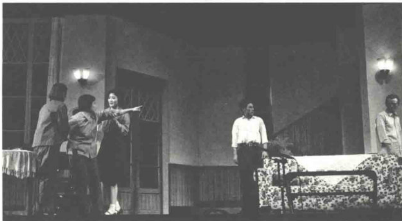
1978年，话剧《于无声处》在上海公演