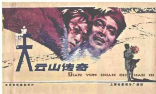
《天云山传奇》宣传海报