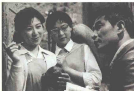
电影《天云山传奇》剧照

报》刊登了短篇小说《伤痕》，揭露了左的错误思想和血统论给中国社会特别是青年一代心灵上造成的伤害，是对“文化大革命”的最初反思。在众多反思文学作品中，最为人们推崇的是中国文学大师巴金创作的散文集《随想录》。巴金以全部生命的热诚和真诚，剖析自己在“左”的错误思想的重重高压下，一颗崇尚真理、民主的灵魂被扭曲，他在解剖自己，也在解剖历史。《随想录》被人们誉为一部“说真话的大书”。此外，著名导演谢晋导演了对新中国成立以来政治运动反思的影片《天云山传奇》《芙蓉镇》《牧马人》，开了反思电影艺术的先河，被人们称为“反思三部曲”。其中《天云山传奇》讲述了天云山综合考察队年轻能干的政委罗群被错划为右派分子送去劳动，但仍然热爱社会主义、热爱党、热爱人民，并且努力工作的故事，同时分析了悲剧产生的根源。《牧马人》讲述了小学教师许灵均被错划右派后做了小半辈子牧马人的坎坷人生，同时也反映了普通人身上迸射出真与善的光辉，抒发了人们对祖国、对人民的深情。《芙蓉镇》通过湘西小镇——芙蓉镇上卖米豆腐的“芙蓉姐”从20世纪50年代到80年代初的遭遇和经历，批判了“左”的错误思想对人性人情造成的扭曲，因其艺术上、思想上的突出成就，影片获得了“金鸡奖”“百花奖”、法国第五届蒙彼利埃国际电影节金熊猫奖等奖项。