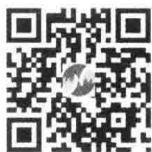
微信扫码立刻刷题

本书名为600题,但未止步于600题。本着传播知识与爱的宗旨,我们还为你准备了线上海量题库,不用关注不用注册,省去繁多步骤。微信扫码,立刻刷题。微信扫码,还可下载初始条件系列讲义。