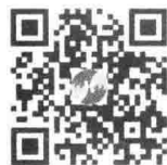
微信扫码下载初始条件系列讲义