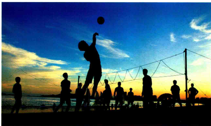
◎ 平潭海上的沙滩排球爱好者