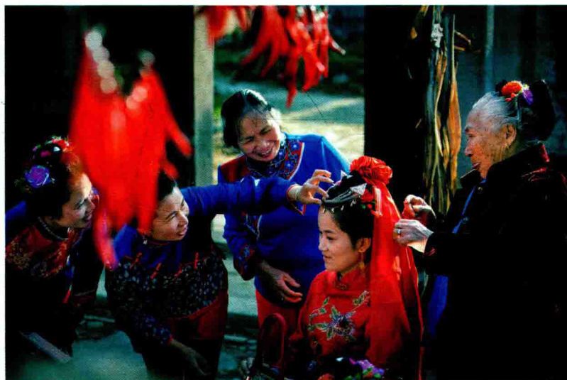
◎ 湄洲女 ◎ Meizhou women.