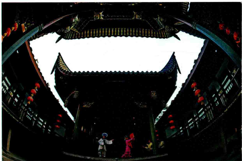
◎ 三坊七巷的闽剧表演

◎ Min Opera performance at Three Lanes and Seven Alleys in Fuzhou.