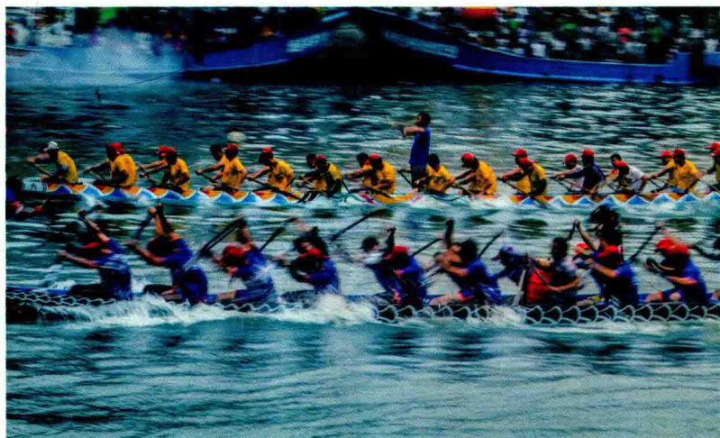
◎ 鼓声三下红旗开，两龙跃出浮水来。棹影斡波飞万剑，鼓声劈浪鸣千雷。 ◎ With drums beating and red flags waving, two dragon boats rush ahead; the oars like swords are wielded to the waves, and drums and breakers sound like thunders rumbling away.