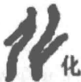
图 1-1 化的甲骨文

文化一词，从表面的词义来看，就是文治与教化。汉代的刘向在《说苑·指武》中说：“凡武之兴，为不服也；文化不改，然后加诛。”《文选》载录的晋代《补亡诗》说：“文化内辑，武功外悠。”这些关于文化的词语体现了文与武、化与功的相对关系，寓意文化是进步的现象。中国古代曾经称天子管辖不到的地区为“蛮夷之区”，对没有接受文治教化的民众称为“化外之臣”。天子对内施以文化，对外也施以文化，对不愿意接受文化的地区，则以武服之。