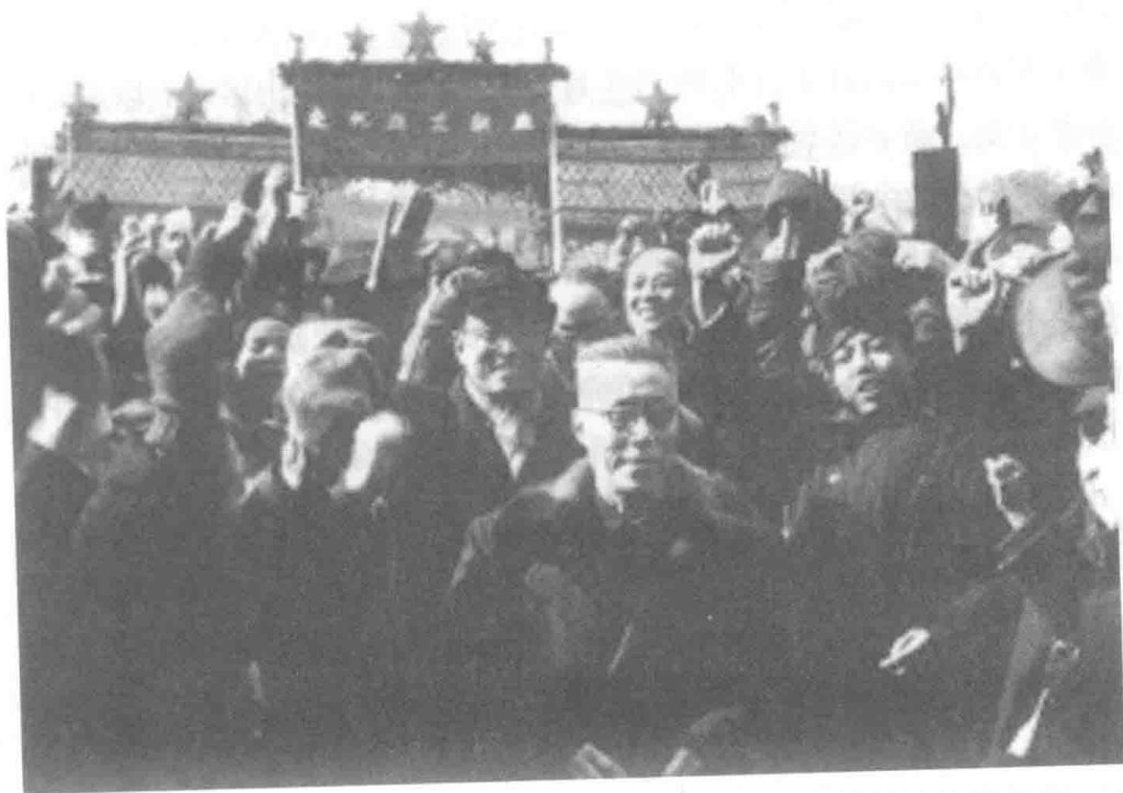
图 1-1 1951 年 2 月 12 日,中央人民政府接收燕京大学,受到师生们的热烈欢迎

建了大量的中小学,以便利工农子女就近入学。 ① 另外,新学校体系的建设也与国家的民族政策相关。我国是多民族国家,民族平等、团结和共同繁荣是我国基本的民族政策。为促进少数民族地区的教育发展,党和国家对少数民族地区从人财物方面采取了倾斜政策。因此新学校体系还包含了国家兴建的少数民族学校、成人业余教育,以及为培养少数民族干部而陆续兴建的西北民族学院、 校的 民族学院等八所民族高等院校。