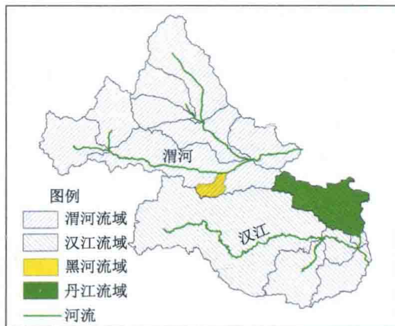
图 1-1 丹江流域和黑河流域位置示意图

丹江流域和黑河流域是秦岭在长期的区域地质演化过程中，于南北坡形成的极其重要的两大水源地，它们既是秦岭南北水系的代表，源源不断地为汉江和渭河注入干净的水流（图 1-1），同时也是秦岭构造变迁的缩影，分别记录着秦岭南北坡地质、气候、生物演化的历史过程。