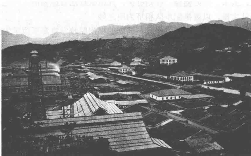
图 1-3 俯瞰福建船政局

船政学堂初名“求是堂艺局”（图 1-3），分为前后学堂，因主要教学用语分为法语和英语，所以又称法文学堂和英文学堂。前学堂主要担负舰船的制造、设计和艺徒的训练工作。 ② 后学堂主要致力于训练学生的英语、航海和工程学，学堂的学生分为航行理论、航行实践和管轮三个专业。 ③