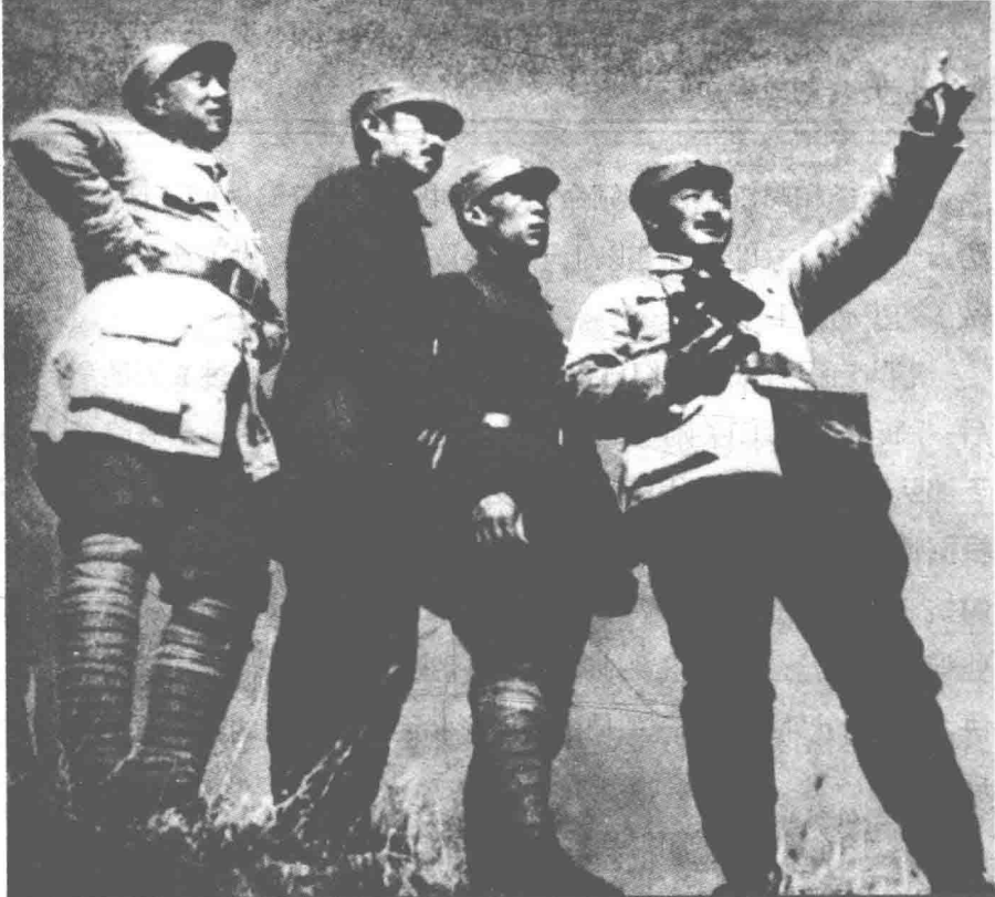
◎贺龙、周士第、关向应、甘泗淇在雁门关前线(右起)

“很好，很好。要收拾敌人，有的是机会。现在就有一个机会摆在我们面前。”贺龙招呼大家聚在地图周围，指着一块密密的山区，接着说，“我们打算把你们761团派到雁门关去。根据我们得到的消息，敌人每隔几天会经雁门关，向忻口战场运送弹药和物资。嚣张的敌人以为这一带已成为他们的后方，警戒十分松懈。派你们到雁门关，就是要你们趁敌人麻痹大意之时，发动群众，寻找机会，给他们致命一击。”