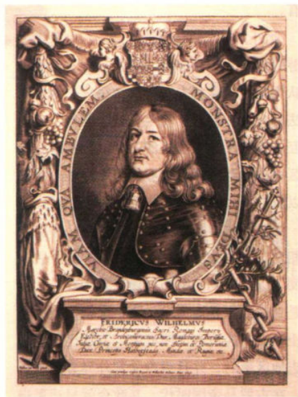
上图：大选帝侯腓特烈·威廉，勃兰登堡-普鲁士的中兴者