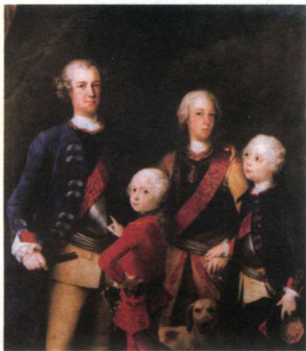
11图：“军人国王”腓特烈·威廉和他的家庭

腓特烈·威廉还创建了普鲁士第一支骠骑兵部队，建立了普鲁士的军备产业，并且计划重新列装普鲁士士兵的燧发枪与佩剑。利格制造商弗朗索瓦·赫努尔帮助腓特烈·威廉完成了武器换代。此后，整个18世纪，普鲁士军队的装备几乎没有再变更过。1718年，普军还引进了一种新的铁制推弹杆。这种推弹杆比欧洲其他国家使用的木制推弹