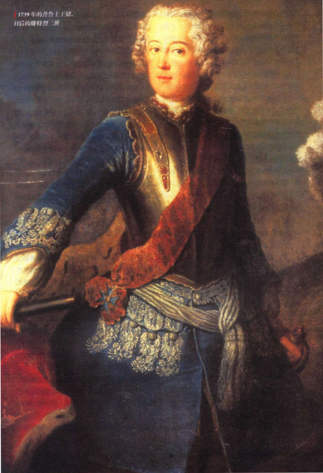
1739年的普鲁士王储， 日后的腓特烈二世