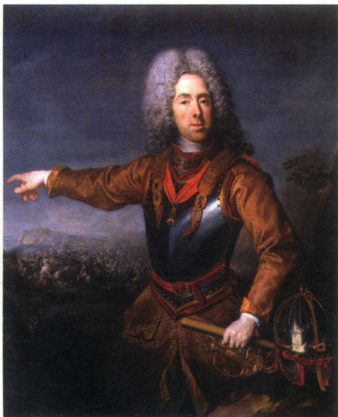
上图： 萨伏伊的欧根亲王。1697年，他在森塔战役中击败了御驾亲征的奥斯曼苏丹穆斯塔法二世的十万大军；九年战争中，他与马尔伯勒公爵协作指挥布伦海姆战役，重创法军；之后，他在意大利歼灭法国军队，极大地扩充了奥地利的势力

的一天。他击退了一队进犯的法军士兵。然后在一次穿越森林的骑马侦察中，他成为法国炮兵的目标，从天而降的炮弹撕裂了他身边的林木，而他依然保持镇定。事后，他的勇气得到了欧根亲王的高度赞赏。晚上，欧根亲王和维滕堡公爵来到这位年轻英雄的营地，同他进行了一次长谈。准备离开时，腓特烈二世给了公爵一个友好的亲吻。欧根亲王立马转过头说道：