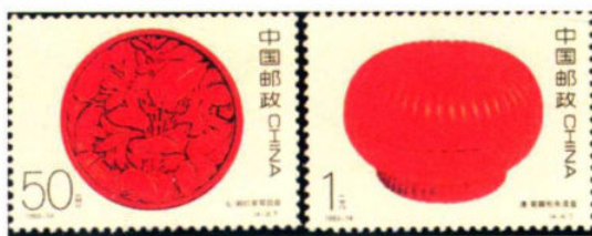
(2-1) 元·剔红紫萼圆盘 (2-2) 清·菊瓣形朱漆盒

漆器是中国古代在化学工艺及工艺美术方面的重要发明，它以优美的图案在器物表面构成一个绚丽的彩色世界。1993年10月23日发行的《中国古代漆器》特种邮票（全套四枚）中，其第三枚《元·剔红紫萼圆盘》和第四枚《清·菊瓣形朱漆盒》的实物藏品均来自故宫。