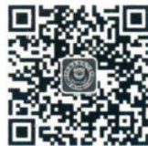
厦门大学出版社 微信二维码