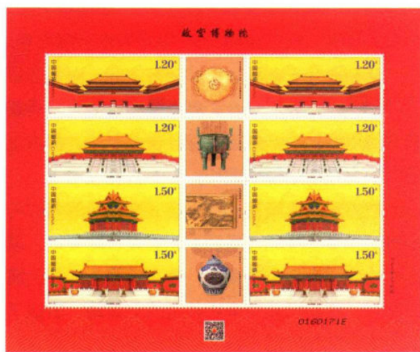
故宫博物院（小版张）

2015年10月10日，为纪念故宫博物院建院九十周年，中国邮政又发行《故宫博物院》特种邮票，全套四枚，票名分别为《午门》《太和殿》《角楼》《乾清门》，同时发行小版张一枚。