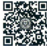
厦门大学出版社 微博二维码