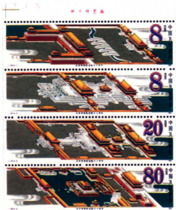
(4-1) 丹阙凌云 (4-2) 太和晴旭 (4-3) 乾坤交泰 (4-4) 琼苑春晖

(4-1)《丹阙凌云》。紫禁城为长方形城池，有城门四座。正门称午门，是一座象征皇宫的阙式建筑，也是紫禁城最大的门，每逢重大典礼以及重要节日，都会在这里陈设体现皇帝威严的仪仗。午门内为横贯东西的内金水河，河上建五座单孔石拱桥，称金水桥。夜色依然浓重，但承天门下的金水桥上已是灯光摇曳，攒动着官员陆陆续续进入的身影，因为他们在三点之前要等候在午门，准备觐见皇帝。从午门至太和门，“阙”为古代皇宫的象征，故称之为“丹阙凌云”。