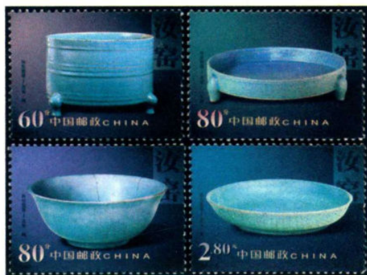
中国陶瓷——汝窑陶瓷

汝窑，宋五大名窑之首。发行于2002年3月30日的《中国陶瓷——汝窑陶瓷》特种邮票，全套四枚，所示的四件器物均收藏于故宫。