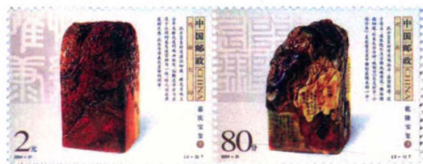
(2-1) 乾隆宝玺 (2-2) 嘉庆宝玺

中国制用玺印的历史久远，艺趣盎然。发行于1997年8月17日的《寿山石雕》特种邮票，其小型张所绘的乾隆链章实物曾被清逊帝溥仪带出故宫，1949年后上交国家，重新收藏于故宫。而发行于2004年9月17日的《鸡血石印》特种邮票（全套两枚），其《乾隆宝玺》和《嘉庆宝玺》也均是故宫的重要藏品。