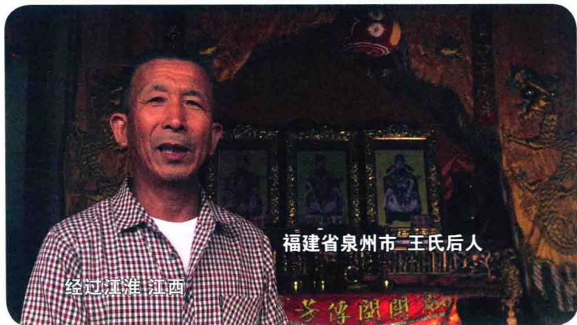
福建省泉州市 王氏后人