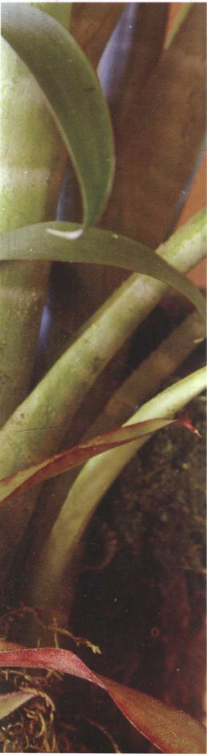
左图：镶嵌在树枝上的丝苇属植物，一种附生类仙人掌科植物。