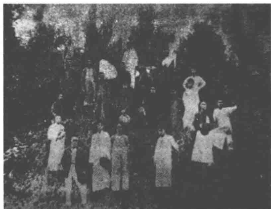
图 1.2 中华森林会支部南京金陵大学 林学会成员合影