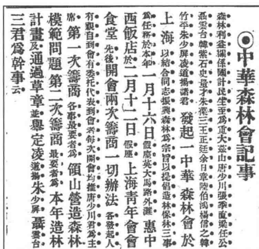
图1.1 1917年3月6日上海 《申报》的部分内容

当时会员寥寥无几,且大多已经是加入中华农学会的会员和金陵大学林科部分在校师生,活动范围局限于南京。金陵大学林科创立于1915年,林科的师生们于民国十