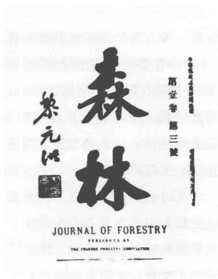
图 1.3 《森林》封面

《森林》杂志于民国十年（1921年）3月问世，这是我国第一份林学杂志，16开本，148页。当时北京政府大总统黎元洪题写了刊名，见图1.3。在创刊号上撰文的有老一辈林学家凌道扬、陈嵘、沈鹏飞、金邦正和金陵大学林科早期毕业生高秉坊、鲁佩璋、李继侗、林