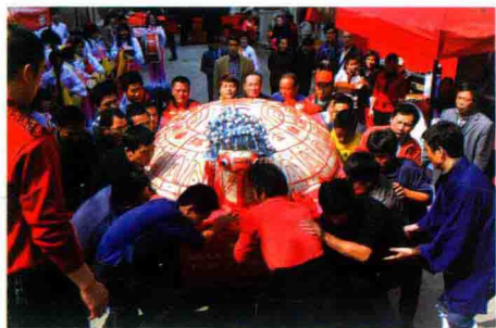
元宵神龟保生大帝活动