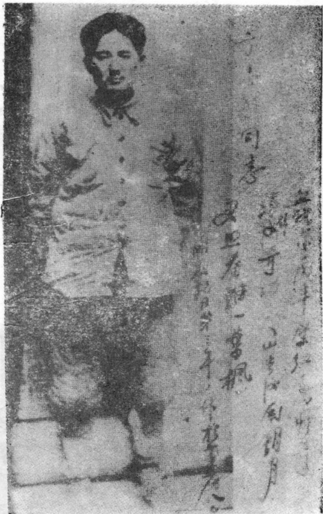
1939年叶剑英同志在方志敏烈士遗像上题诗