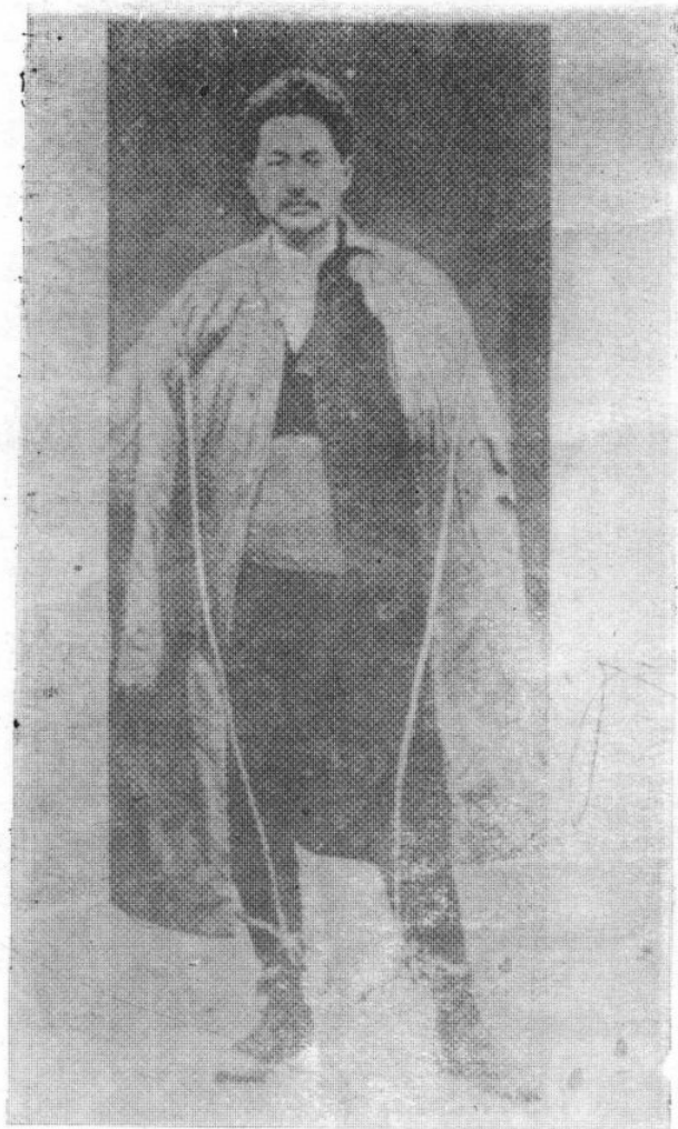
方志敏烈士被捕后穿大衣、戴脚镣，脚镣用绳子绑着挂在脖子上的照片。