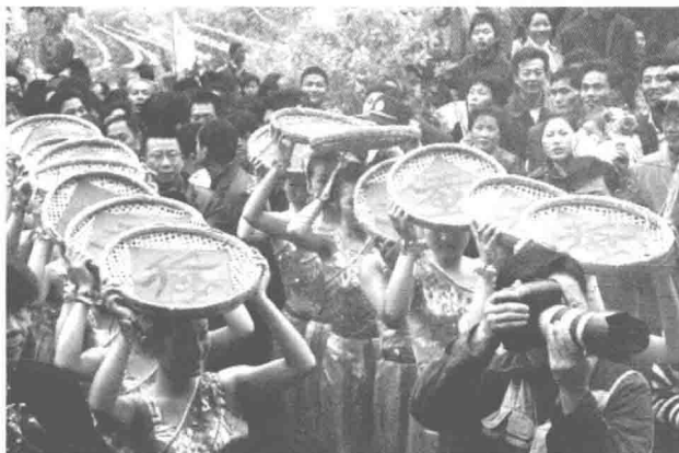
1995年湖州含山蚕花节

含山位于湖州东南32公里善琏镇含山村。含山向来被称为蚕花圣地，相传蚕花娘娘清明节期间化作村姑走遍含山，留下蚕花喜气，