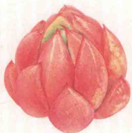
- 红宝石 -