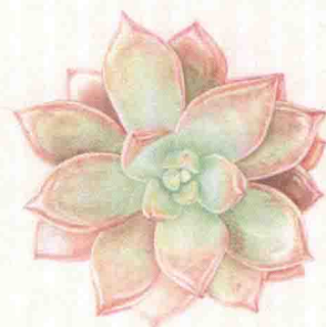
- 淡雪 -