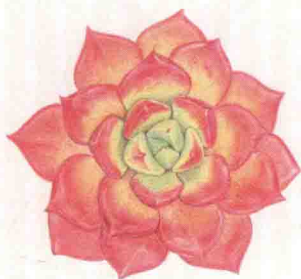
- 蒂亚 -