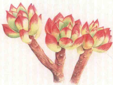
- 酥皮鸭 -