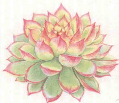
- 女雏 -