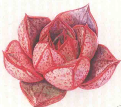
- 大和锦 -