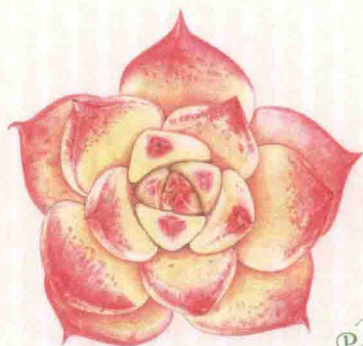
- 水蜜桃 -