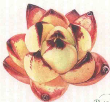
- 乌木 -