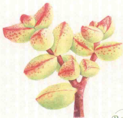
- 半球乙女心 -