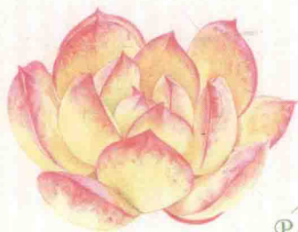
- 莎莎女王 -