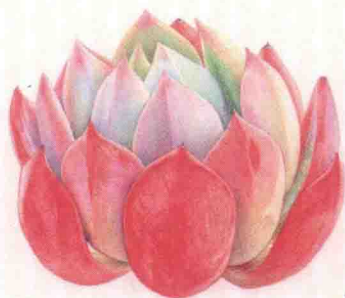
- 桃乐诗 -