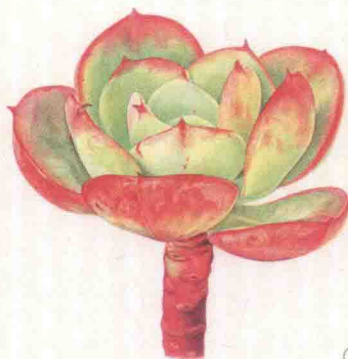
- 碧桃 -