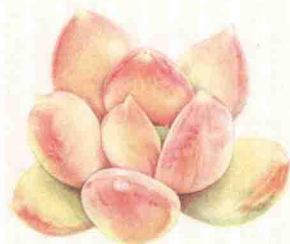
- 奶油公主 -