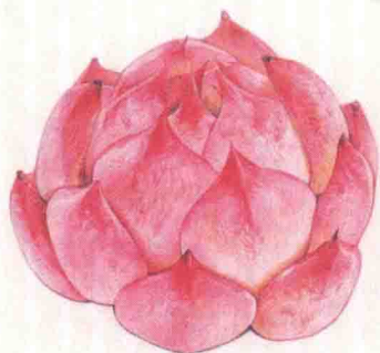
- 冰莓 -