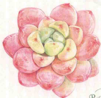
- 劳尔 -