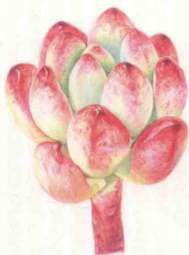
- 汤姆漫画 -