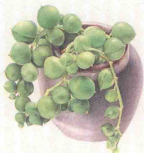
- 佛珠 -