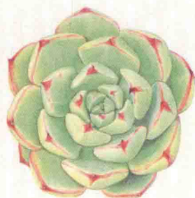
- 落颜 -