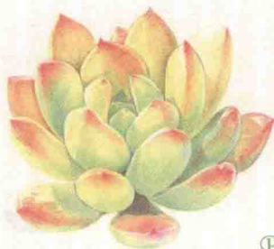
- 春萌 -