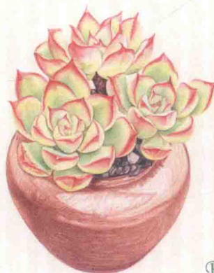
- 花月夜 -