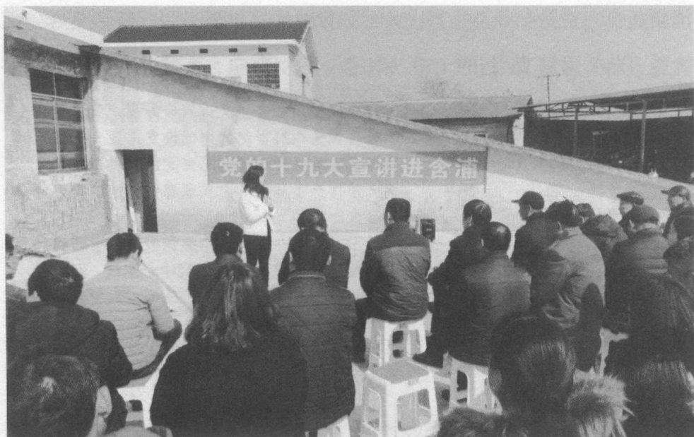
湖南通过开展“三做一评”活动，让习近平新时代中国特色社会主义思想飞入寻常百姓家。图为2018年2月，长沙市委讲师团组织基层宣讲员在农村宣讲习近平新时代中国特色社会主义思想

姓微宣讲等“九个一”子活动，从“分层”的角度突出考评党委（党组）理论学习中心组和县处级以上党员领导干部，从“分级”的角度突出考评省、市、县、乡、村五级党组织，奖优罚劣、选树典型，压实责任、传导压力，确保习近平新时代中国特色社会主义思想“天天见”“天天新”“天天深”推进有方向、检验有尺度、效果有保证。