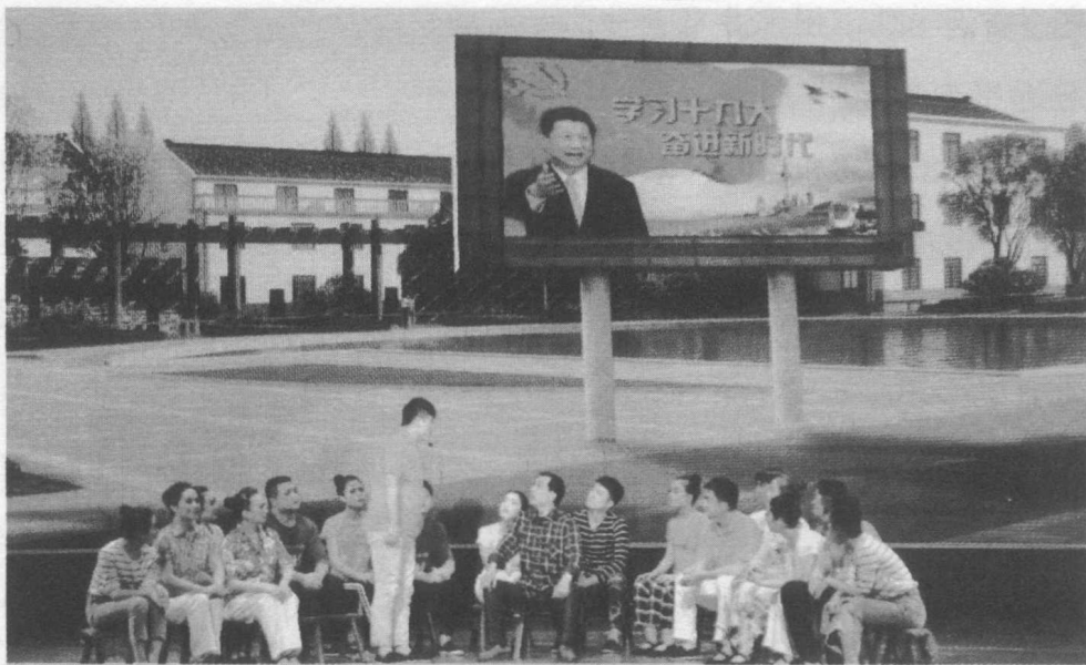
湖南打造特色理论宣传模式，让习近平新时代中国特色社会主义思想宣讲更接地气。图为2018年5月31日，益阳市“新思想 新时代——学习贯彻党的十九大精神专题文艺演出”在南县拉开帷幕