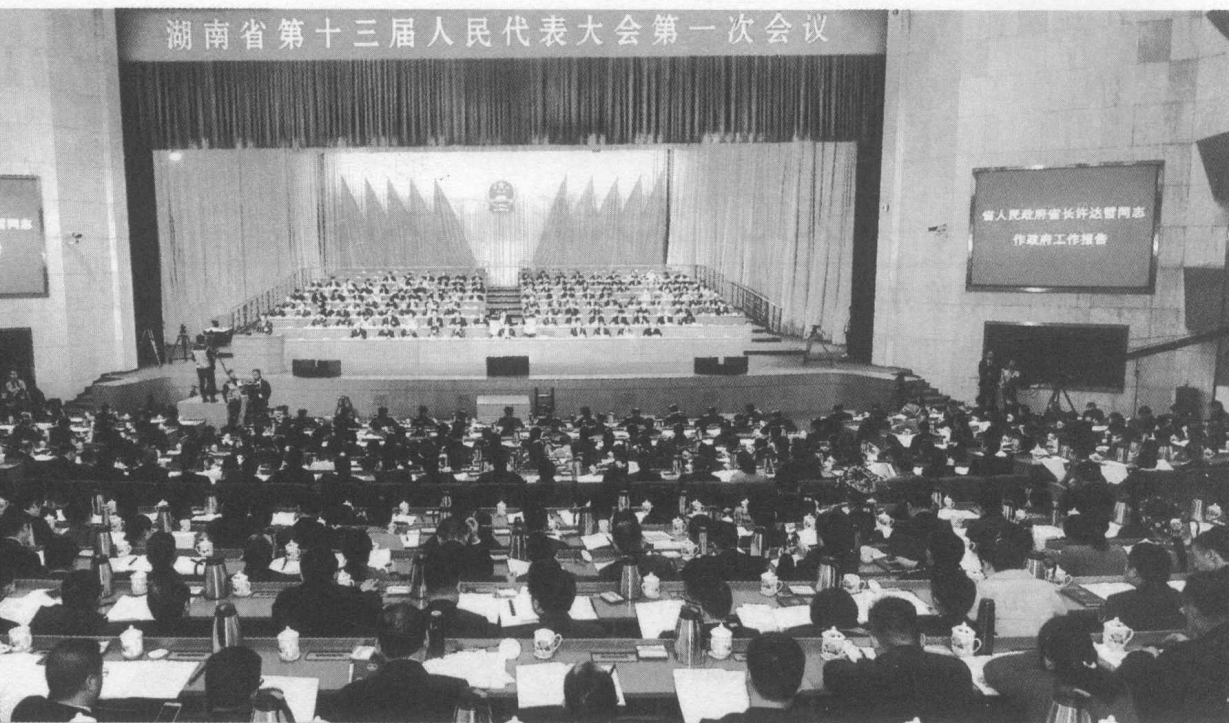
2018年1月24日，湖南省第十三届人民代表大会第一次会议在省人民会堂开幕。会议全面贯彻党的十九大精神，以习近平新时代中国特色社会主义思想为指导，引领全省人民建设富饶美丽幸福新湖南。图为会议现场