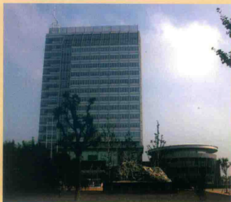
莱西市供电公司办公大楼

莱西市供电公司是国家一流县级供电企业，2006年被命名为国家一流县级供电企业，先后被授予全国消费者满意单位、全国创争先进单位、2008年度全国学习型组织单位、山东省管理创新十佳企业、山东省设备管理先进单位、山东省百姓口碑满意十佳单位、山东省第七届消费者满意单位、山东省安全生产先进单位、省级文明单位、山东省安全生产标准化二级企业、青岛市行风建设示范窗口等荣誉称号。