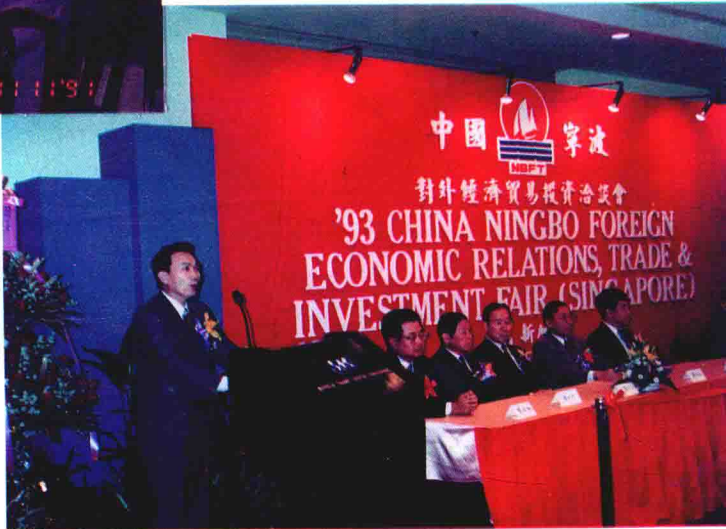
▶ 宁波市副市长谢建邦在1993年宁波市在新加坡举办的对外经济贸易投资洽谈会上致开幕词。