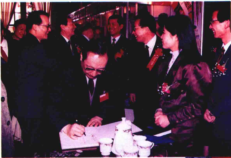
◀ 对外经济贸易部部长李岚清参观1991年华东出口商品交易会宁波馆时签名留念。后排左2朱榕基同志。