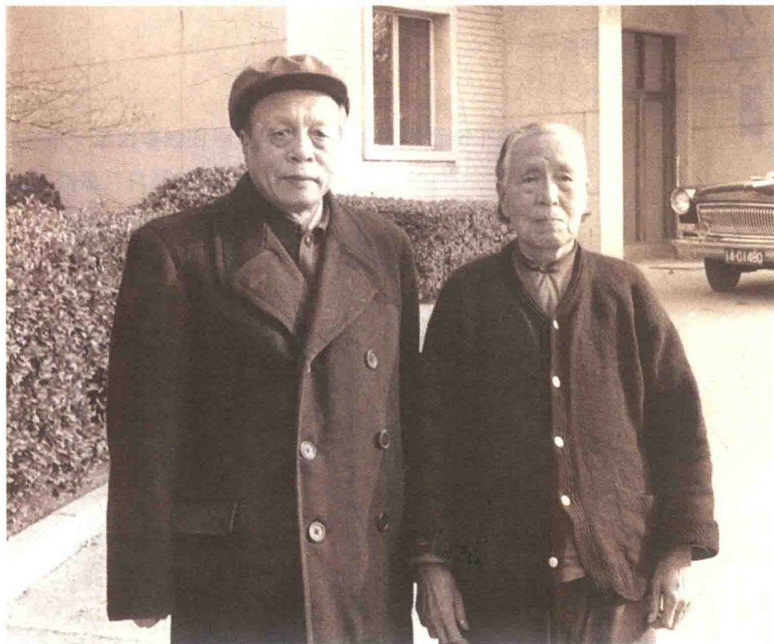
1978年，任仲夷到济南看望后娘韩齐眉