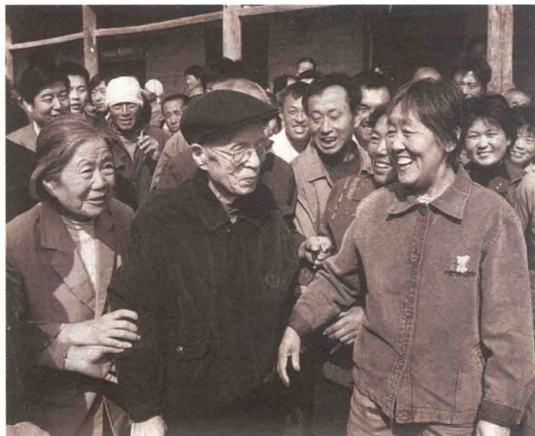
2004年10月，时年91岁的任仲夷回到阔别了60年的家乡，乡亲们热烈欢迎他