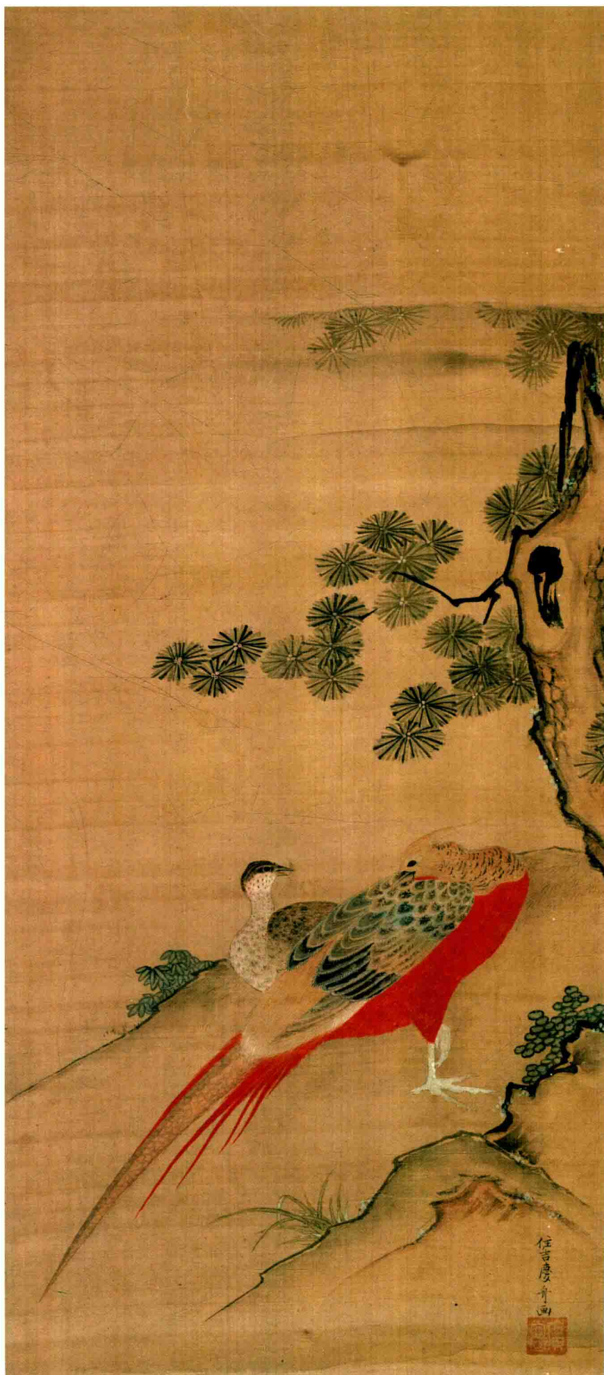
住吉广尚 锦鸡图轴 绢本 设色 84cm × 36cm

住吉广尚（1781—1828，天明元年—文政十一年），住吉广行长子。画得父传，世袭德川幕府御绘师，亦长于书画鉴定，作品中常钤“藤原广尚”名章。