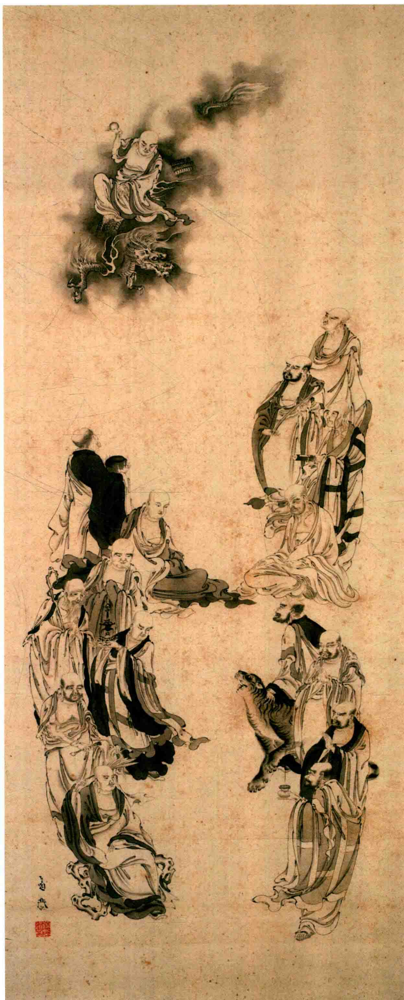
鬼头道恭 罗汉图轴 绢本 水墨 124cm × 50cm

鬼头道恭（1840—？，天保十一年—？），字一斋，通称玉三郎。尾张（今爱知县）人。崇尚巨势派。