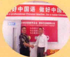
TESOL 中国力量 TESOL Power, China