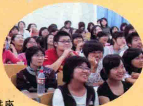
大学讲座 lectures at colleges