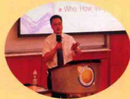
大学演讲 College Lectures

当Hugo挺身而出时，当《给力英语听说宝典》出版时，一扇新窗被开启，一颗新星升起！这颗星星的光芒必将照亮英语学习的未来！