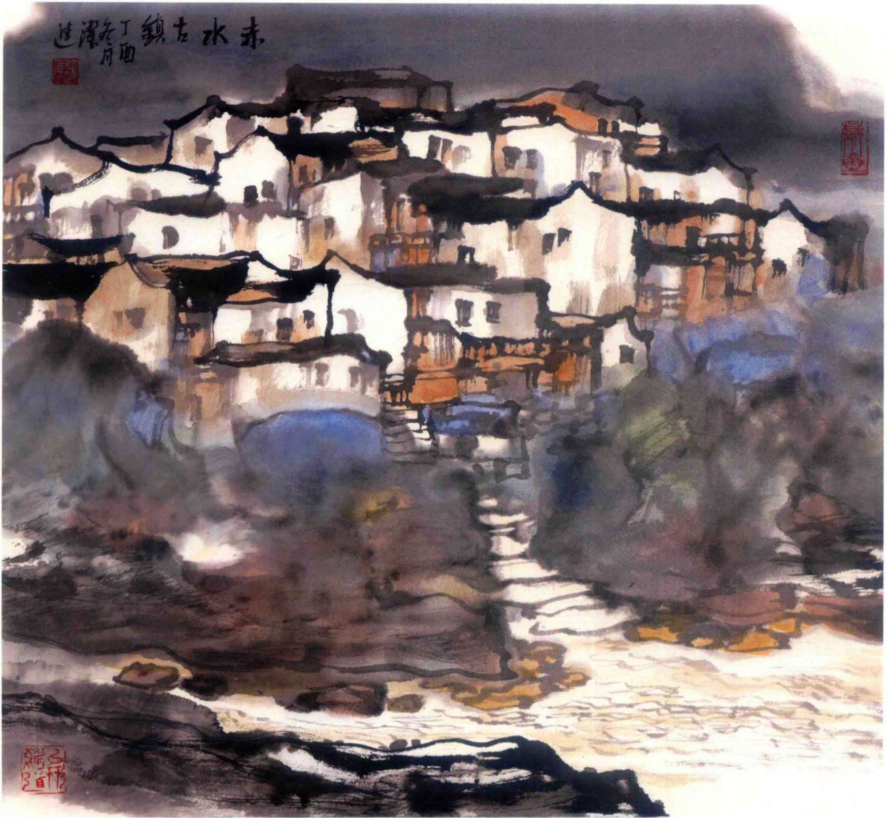
赤水古镇 2017年 纸本设色 49cm × 45cm