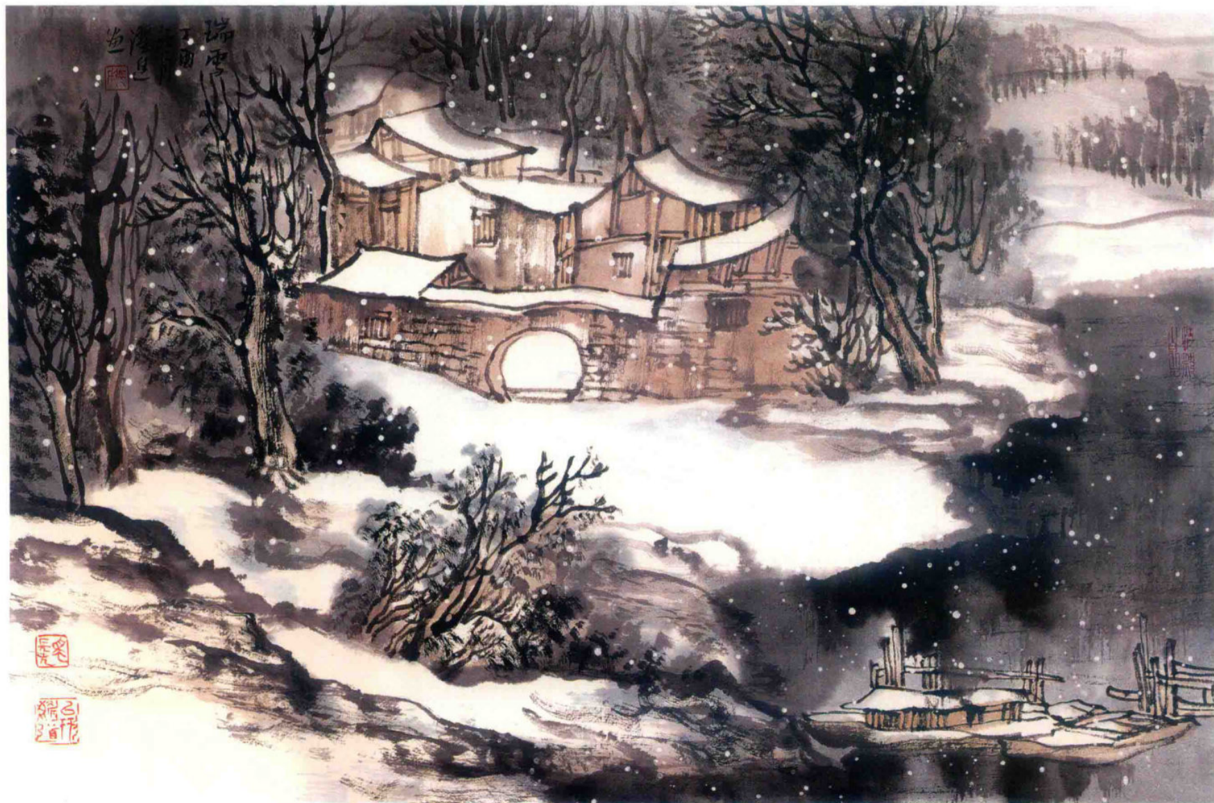
瑞雪 2017年 纸本设色 46cm × 70cm