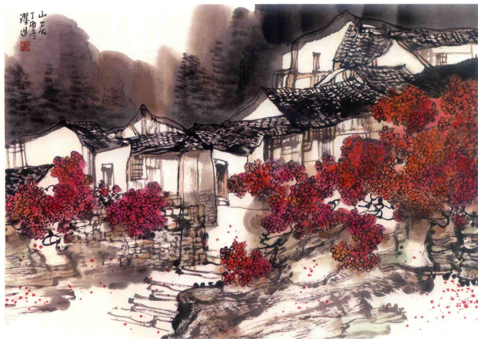
山居 2017年 纸本设色 48cm × 69cm