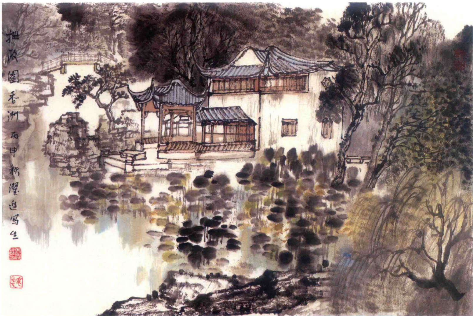
拙政园写生 2017年 纸本设色 46cm × 69cm