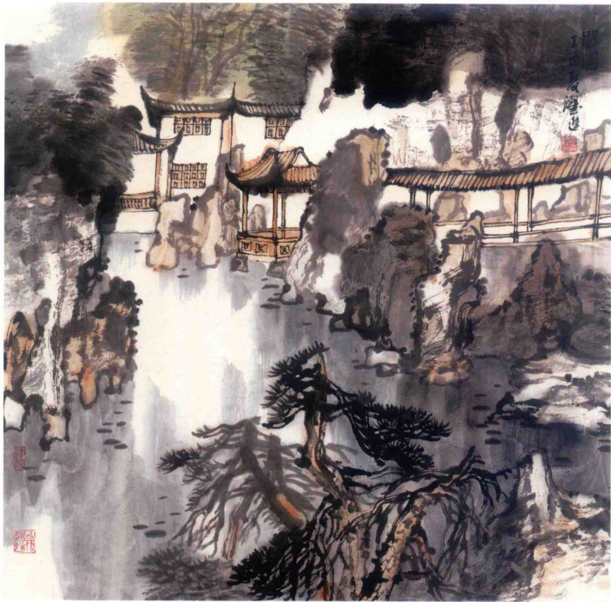
留园 2017年 纸本设色 69cm × 69cm