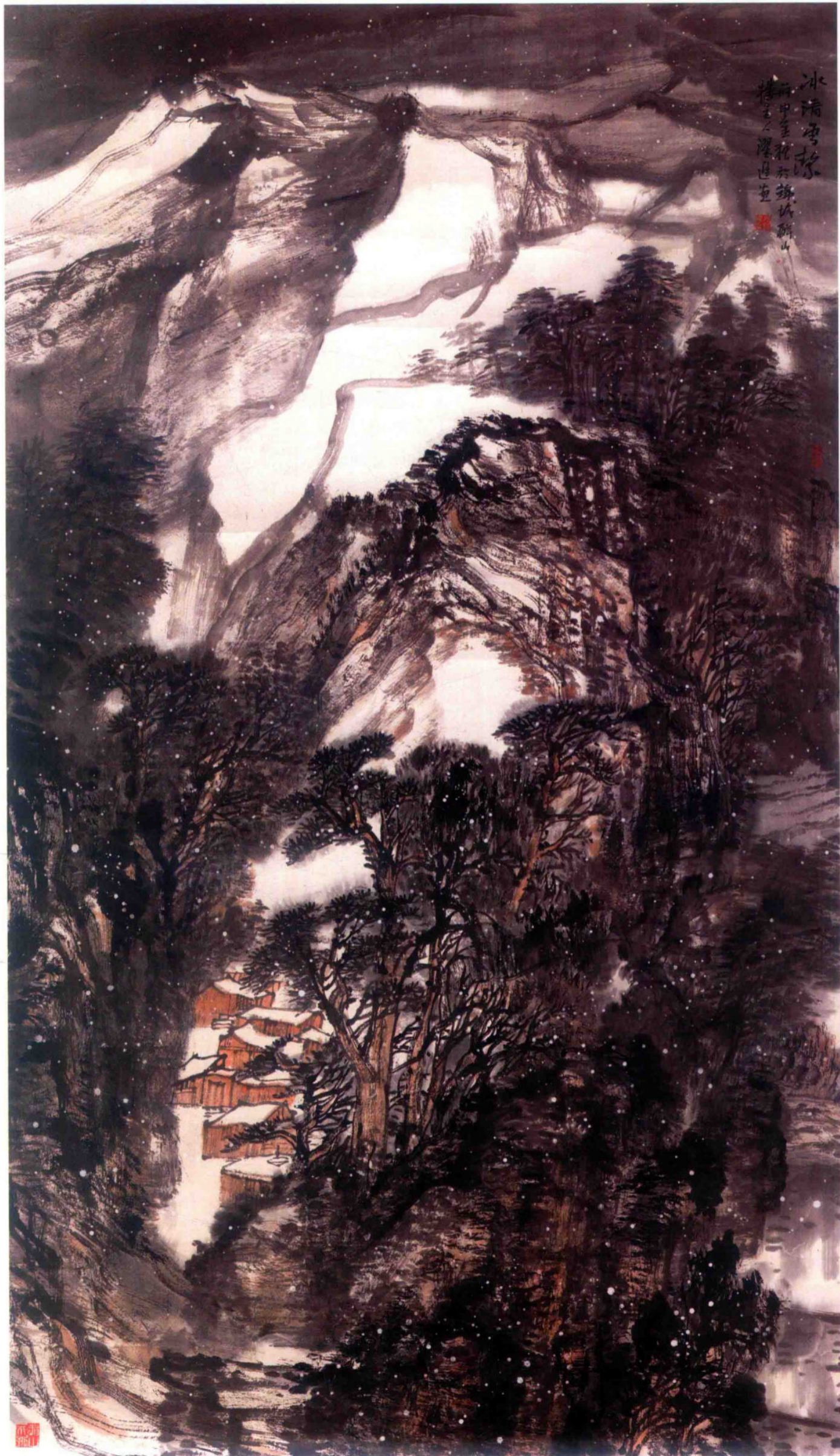
冰清雪洁 2016年 纸本设色 178cm × 102cm