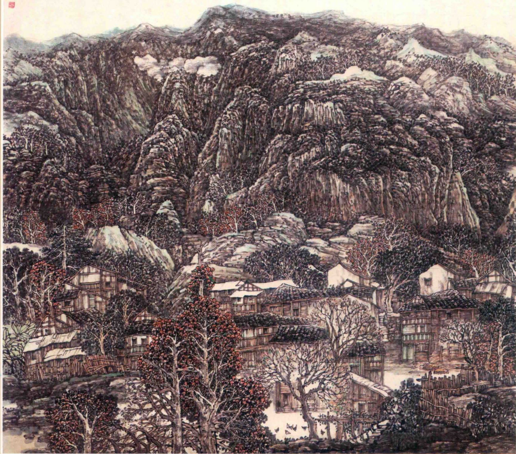
山寨的记忆 / 2015年 / 纸本设色 / 180cm x 180cm