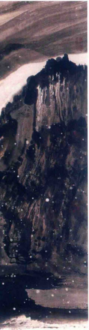
一川寒浸玉 2016年 纸本设色 68cm x 136cm