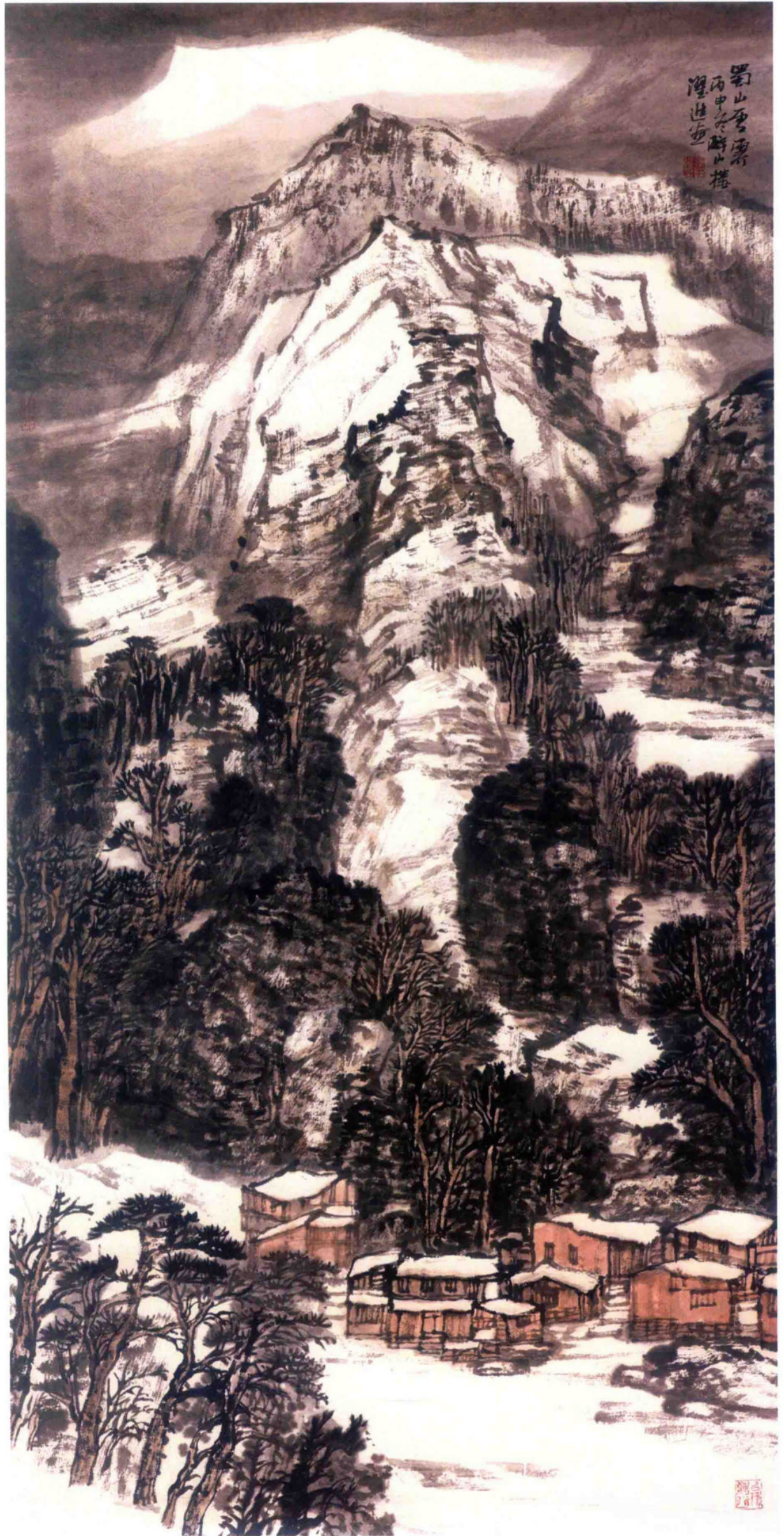
蜀山雪霁 2016年 纸本设色 136cm × 68cm