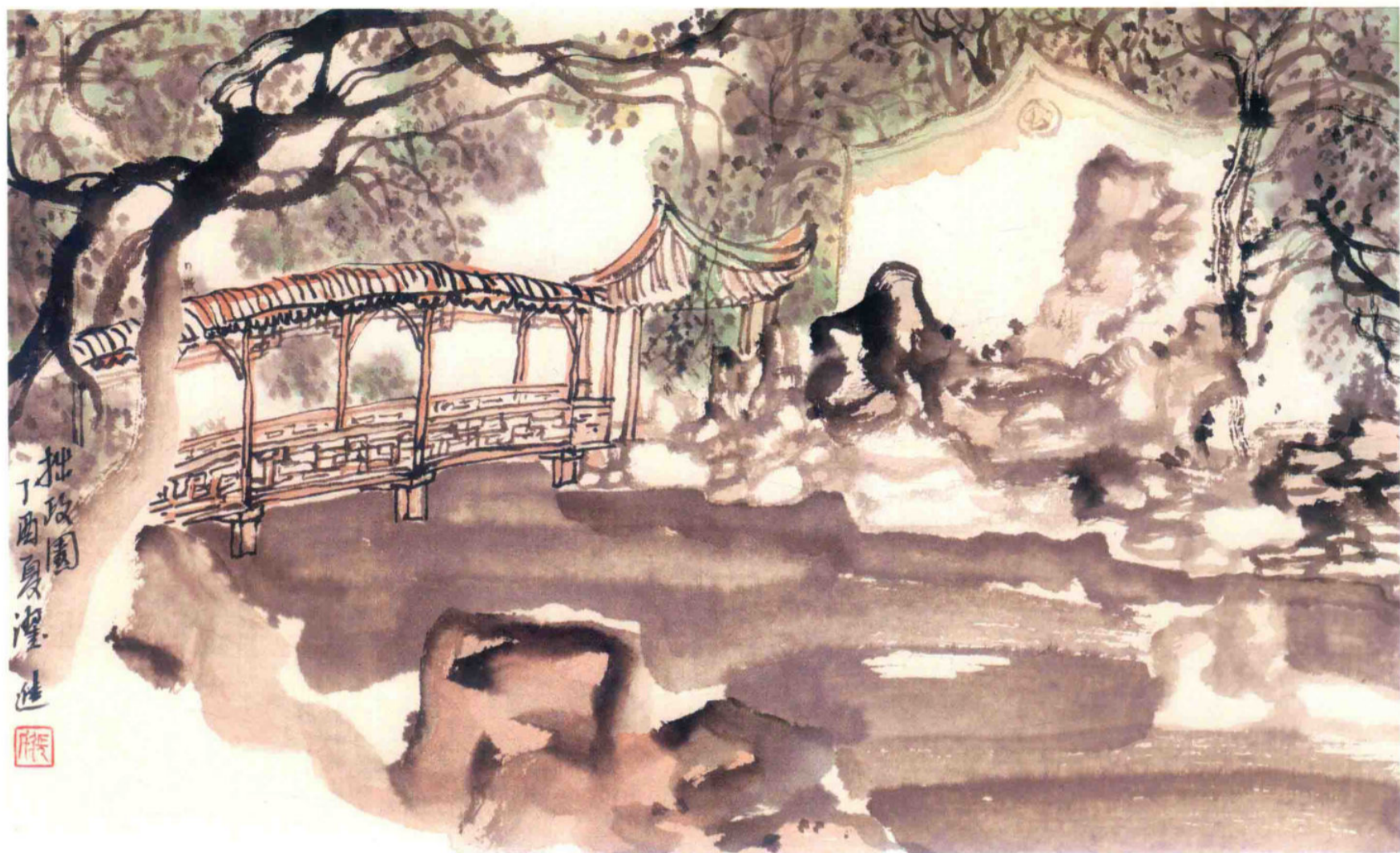
拙政园 2017年 纸本设色 30cm × 50cm