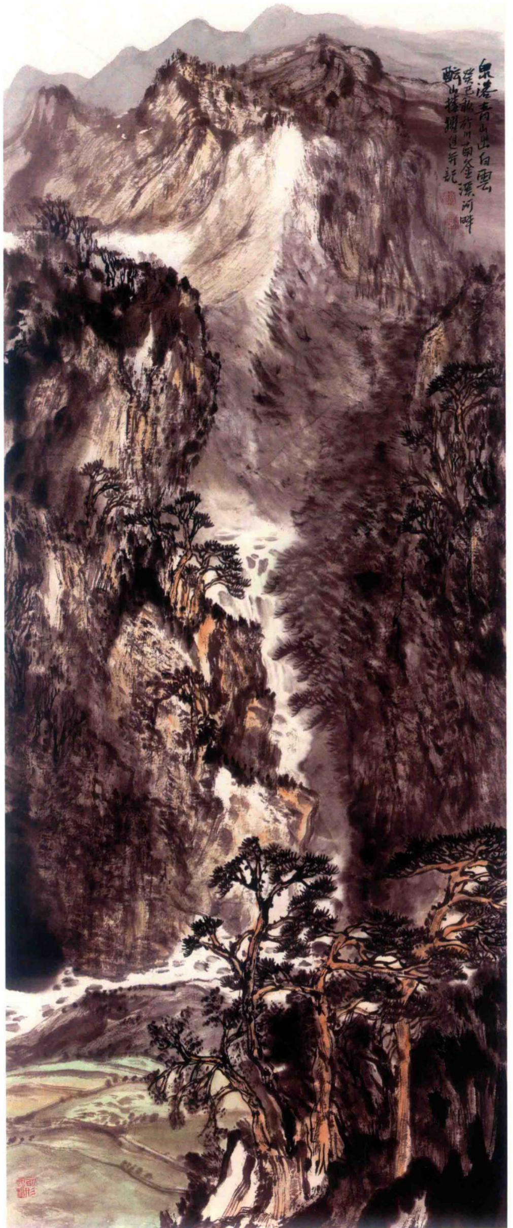
泉落青山出白云之一 2013年 纸本设色 180cm x 80cm