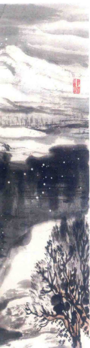
瑞雪芬华 2017年 纸本设色 68cm x 136cm