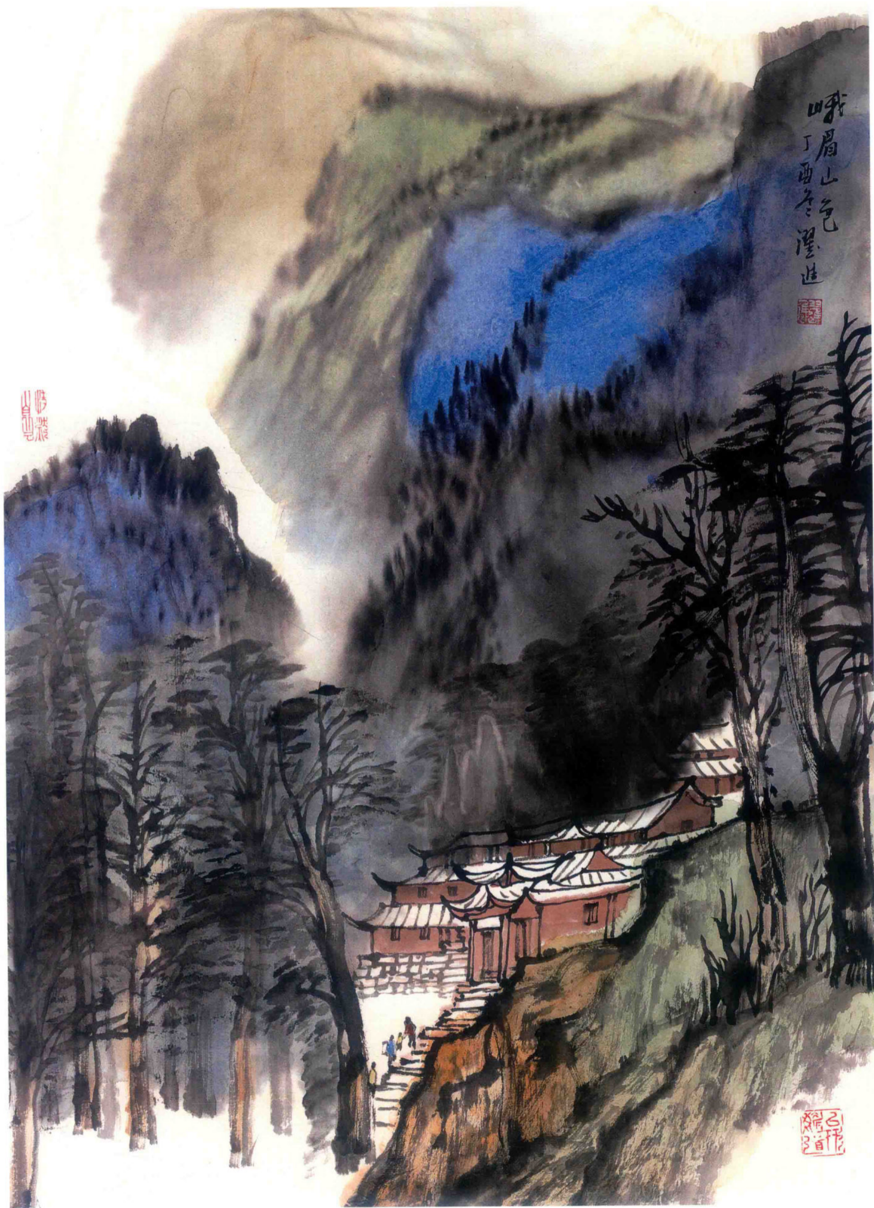
峨眉山色 2017年 纸本设色 69cm × 50cm