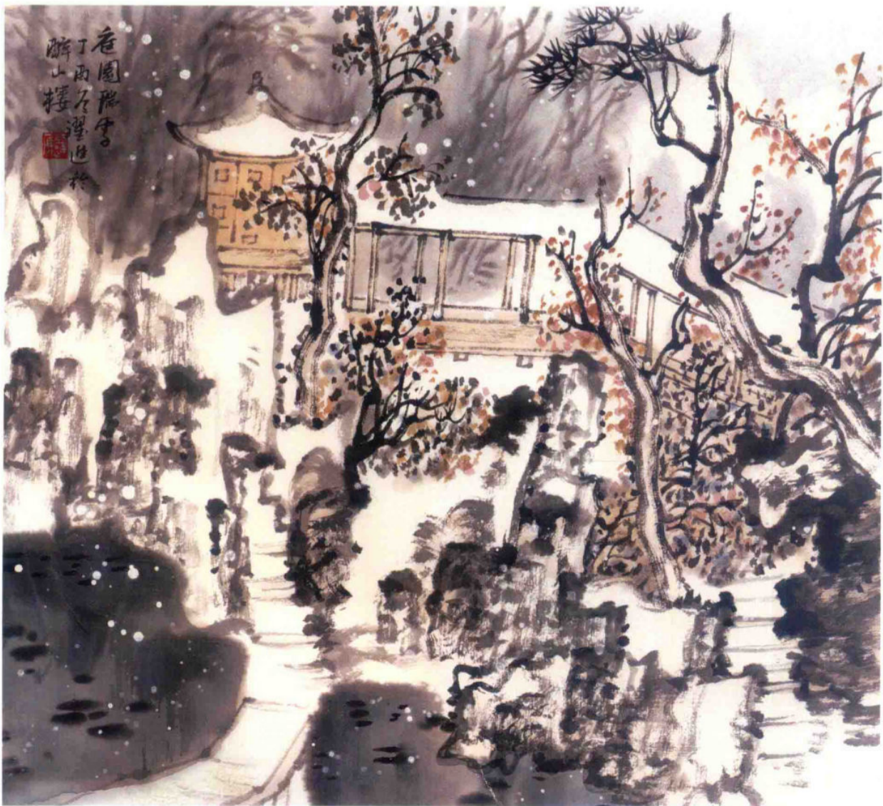
庭园瑞雪 2017年 纸本设色 69cm × 69cm