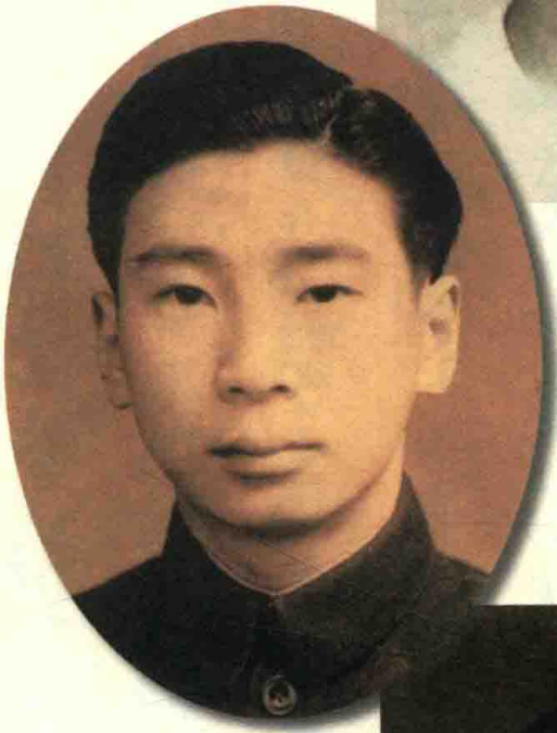
一九四八年生日摄于实验中学（十七岁）