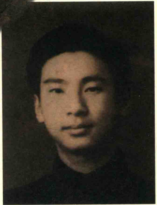
一九四九年高中毕业前夕（十七岁）