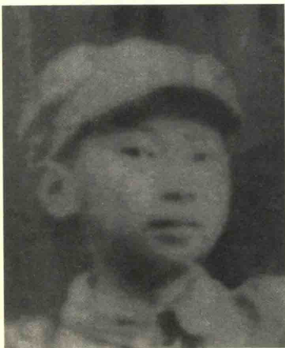
一九四五年抗日战争胜利日 摄于恩施（十四岁）