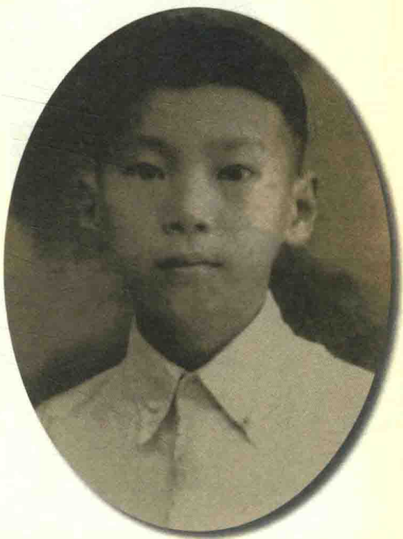
一九四三年在实验中学初中一年级 注册簿上的照片（十二岁）