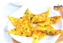
166 黄瓜胡萝卜煎蛋饼