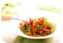
82 萝卜干腊肉炆芹菜